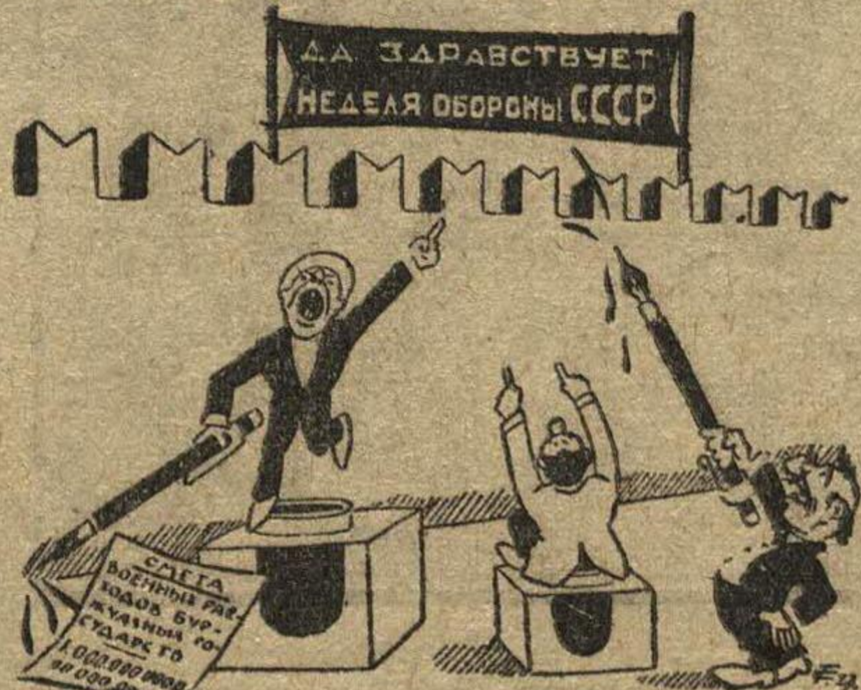
БУРЖУАЗНЫЕ ПИСАКИ. Вот он, красный милитаризм.

Далее идут более откровенные формы агитации. В любом из соседних государств организуются массовые гулянья военного характера, но на