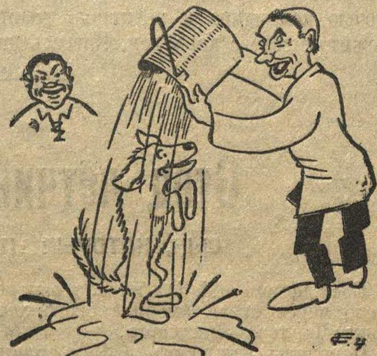
Заботится о... собаке, а на производство—плевать.

Кайрисс (мастер). Сказать, что вся молодежь плохо относится к производству, к своему обучению—будет неверно. Но, что среди вас много лодырей, много невнимательно относящихся к работе—это фант.