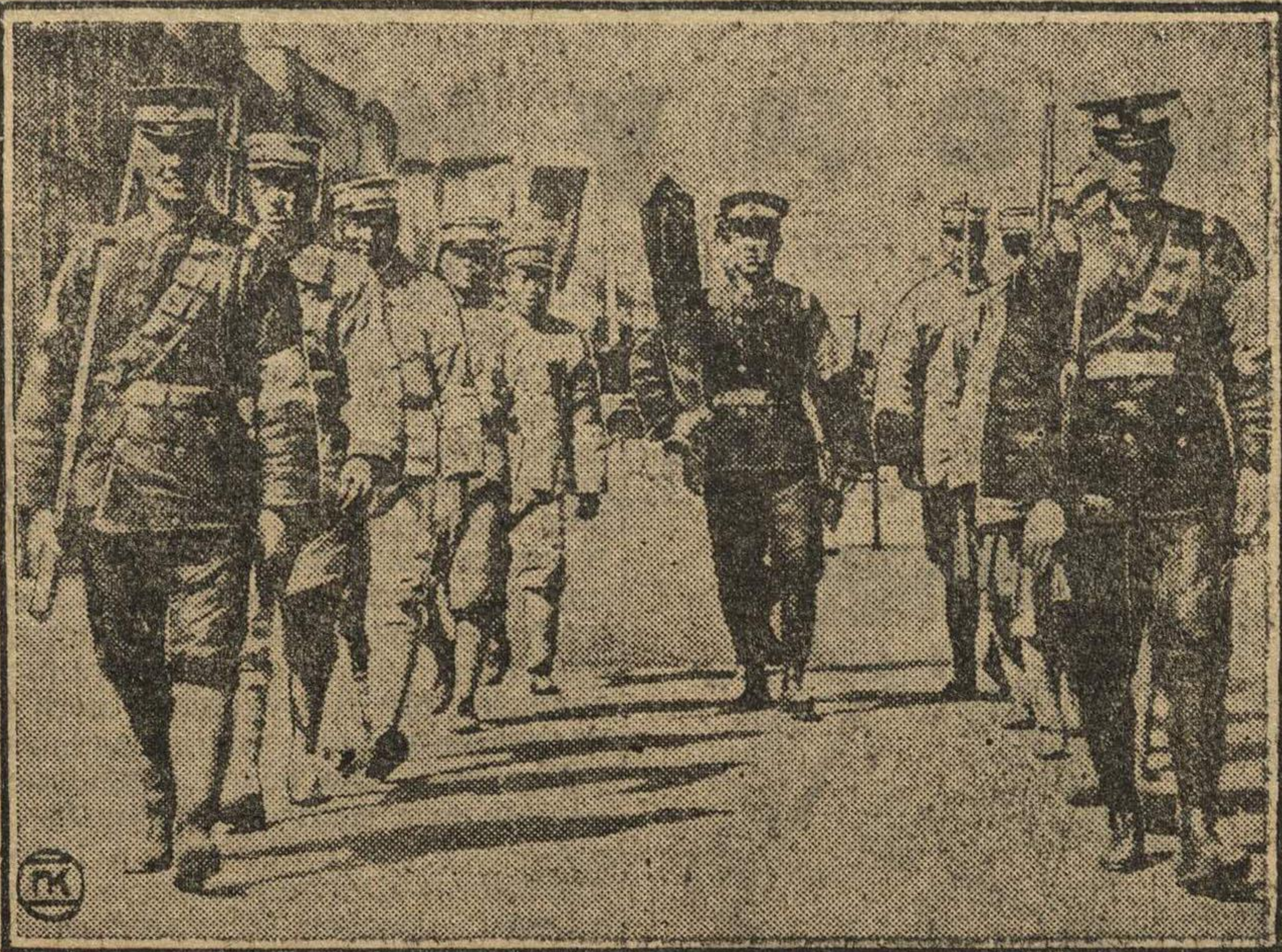
На нашем снимке отряд солдат, с палачем посередине. Это один из карательных отрядов реакционного генерала Сун-Чун-Фана. По сообщениям газет, Чан-Кай-Ши сейчас такими же методами «усмиряет» народ. С Чан-Кай-Ши не легче, чем с Сун-Чун-Фаном—говорит пролетариат.

Пекинское правительство заявило протест. Но что значит дипломатическая нота перед штыками империалистических отрядов?