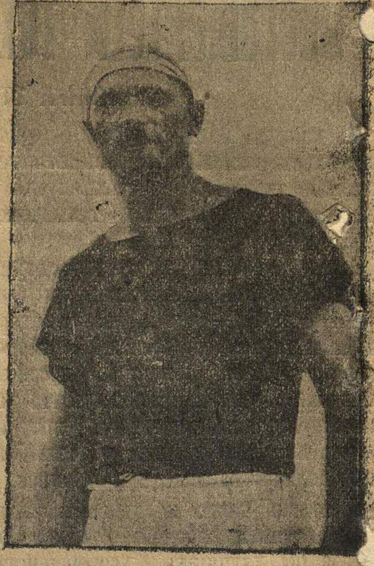
«ФИЗКУЛЬТУРНИК С БОРОДОЙ» Т. ЦАРЕВСКИЙ.

Нельзя не вспомнить, что много еще потеряла нижегородская команда от ухода мобилизованных для участия в