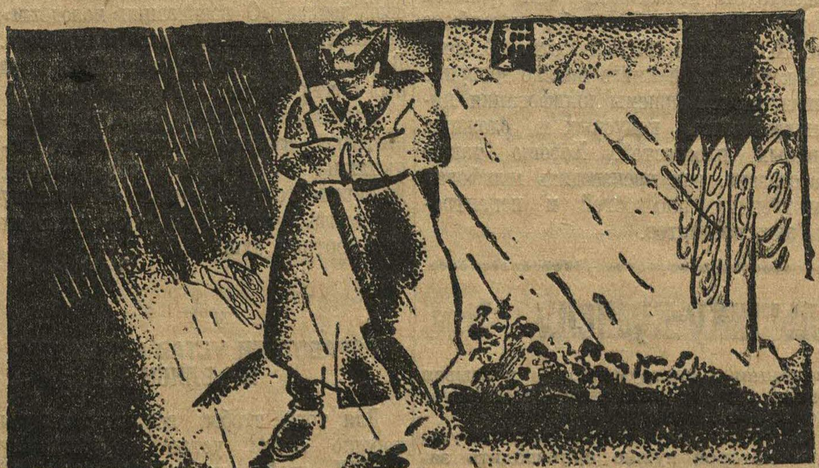
ИНОГДА ДЕНИСОВ ОСТАНАВЛИВАЛСЯ.

Небо собиралось плакать. И ветер, точно радуясь его возможным слезам,