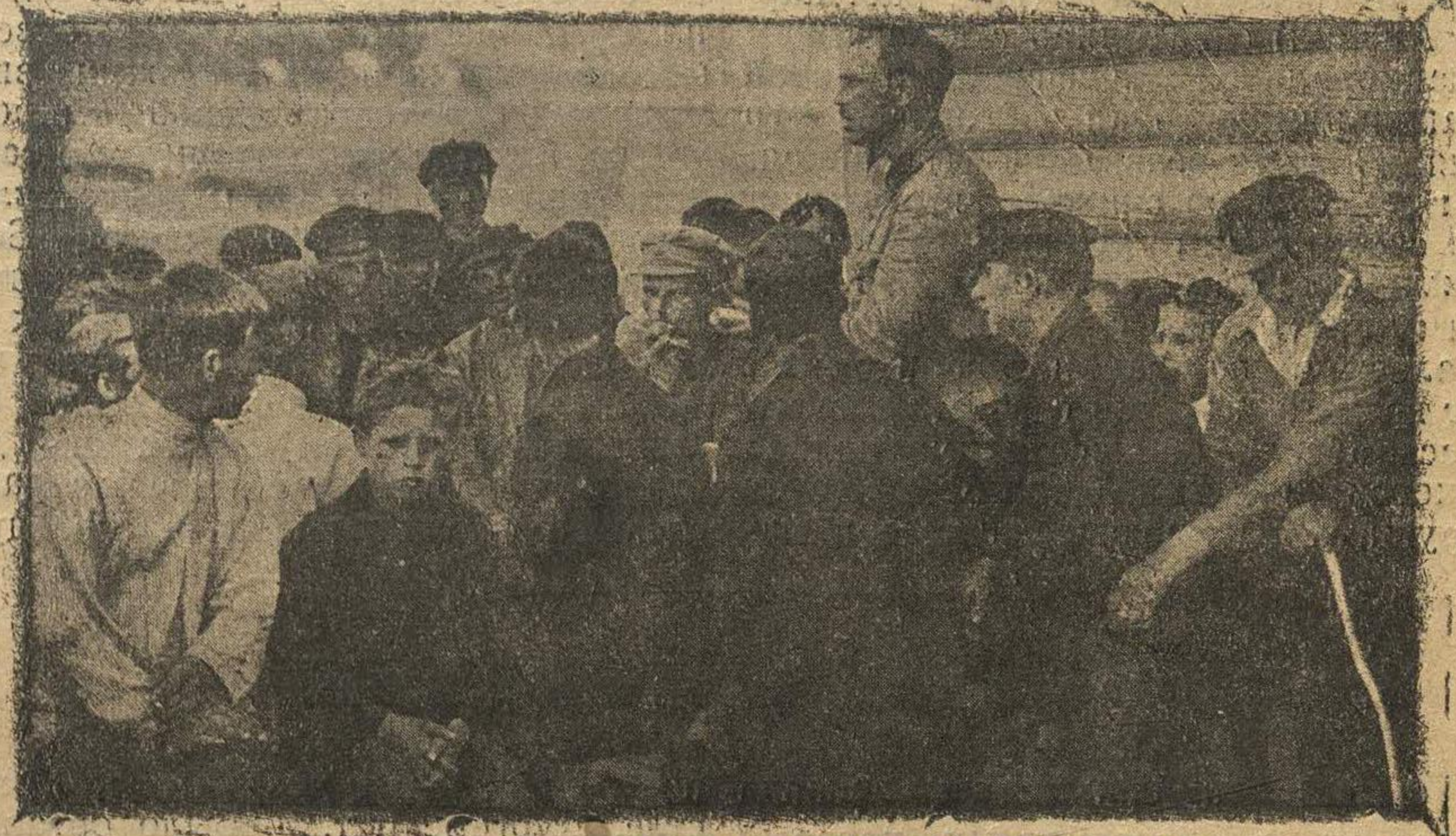
НА СНИМКЕ—БЕСЕДА С ПЕРЕМЕННИКАМИ.

совершенная неяска некоторых. В отношении двух остальных задач дело обстоит много лучше. Полученные знания перемен. помнят, а настроение вполне бодрое. По окончании занятий по пунктам проведены собрания, где разреша-