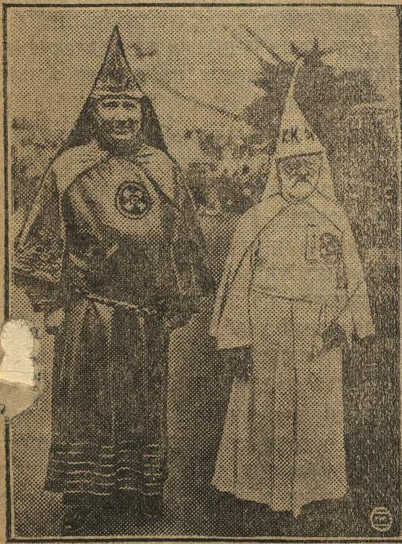
Герои обезьяньих процессов, вожди фашистской организации Клу-Клукс-Клан в Америке—доктор Хиран-Уэсли Эванс (слева) в полном облачении и его соратник.