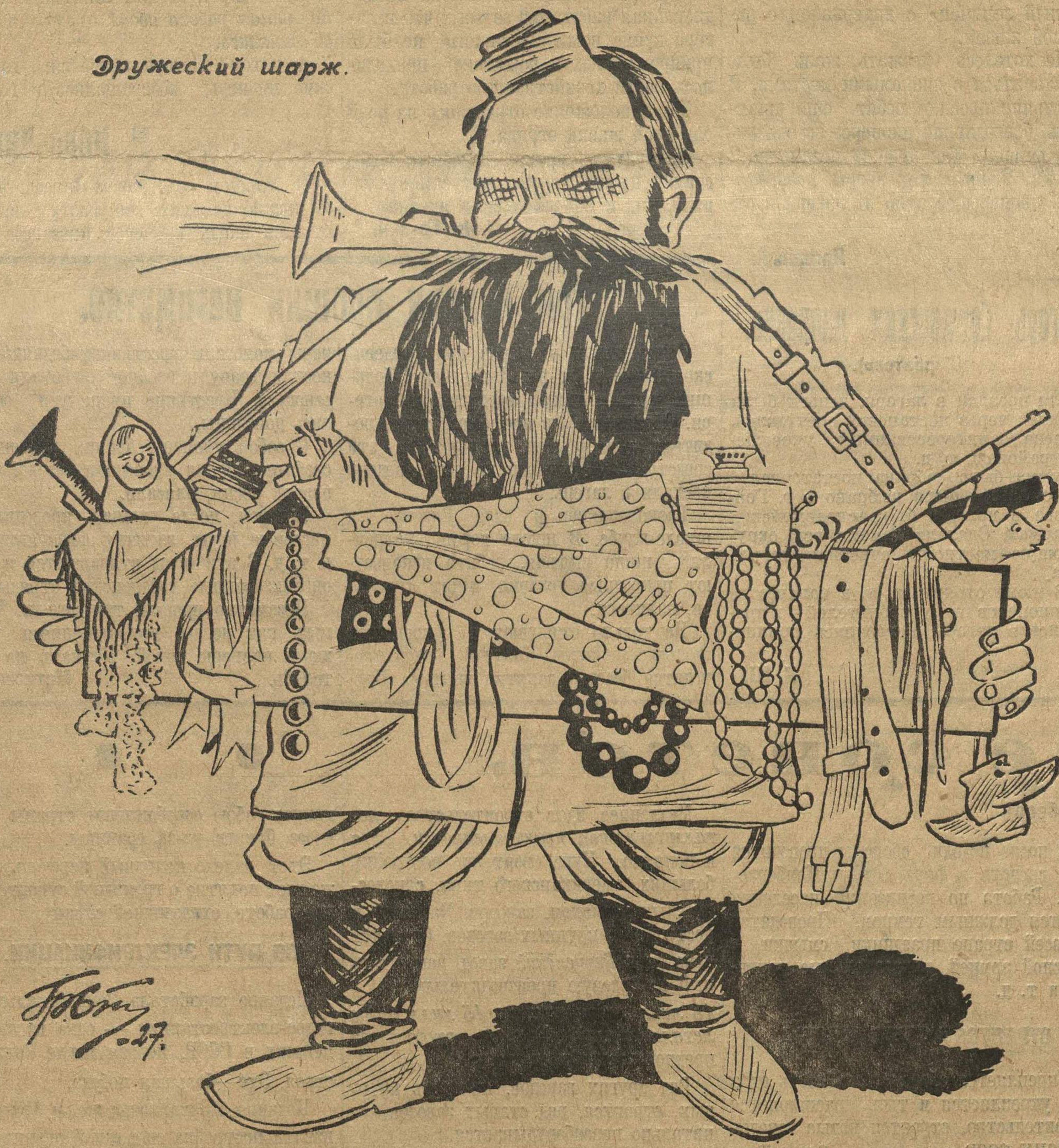
„Эх, полным — полна моя коробушка“.

вились под знамя гоминдана, чтобы разложить изнутри силу революции. Буржуазия перешла на сторону врагов революции. Помещики делали все для подавления поднявшегося крестьянского движения. Многие генералы национально-революционной армии изменили революции.