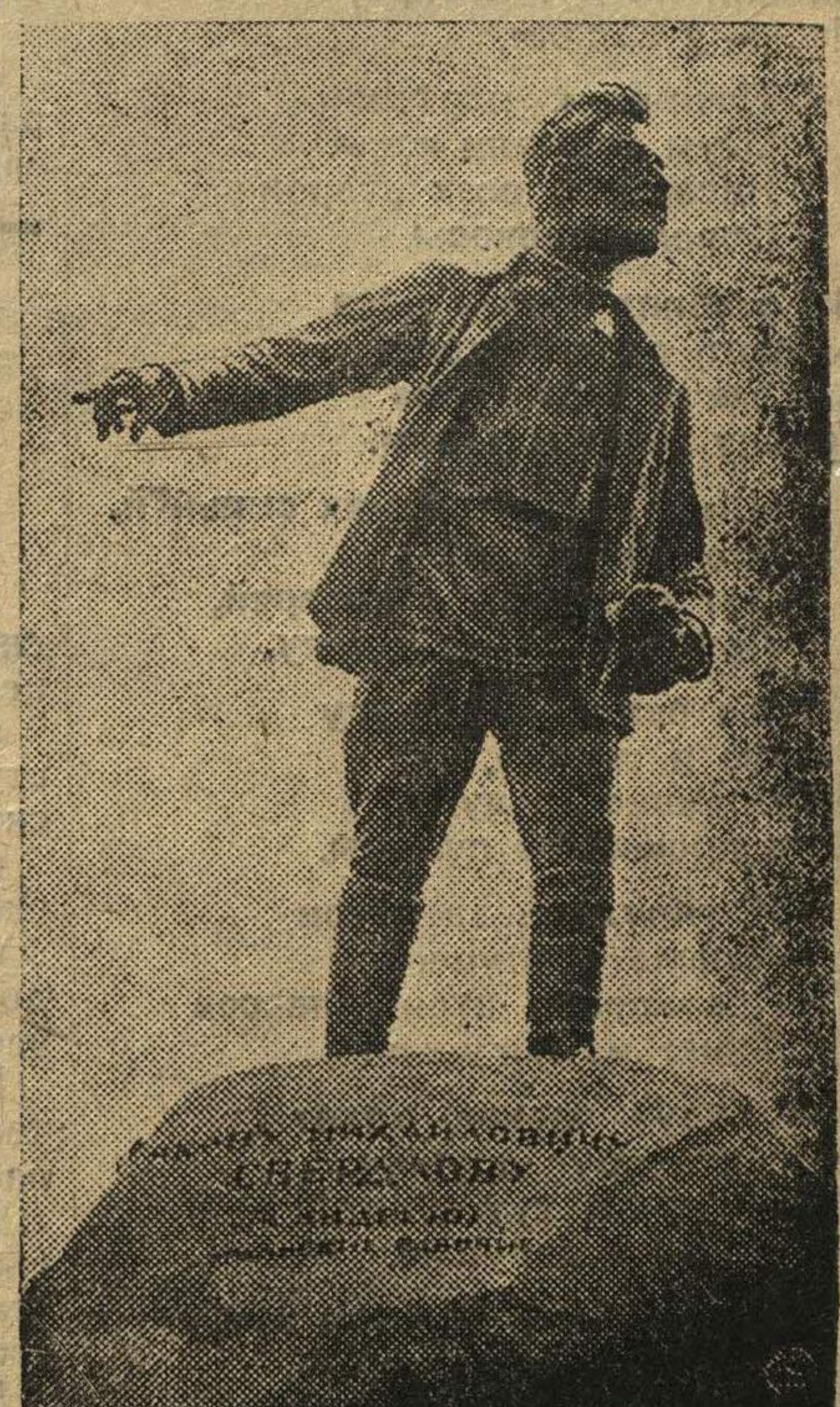
15 июля состоялось открытие памятника Я. М. Свердлову в г. Свердловске, на Урале.