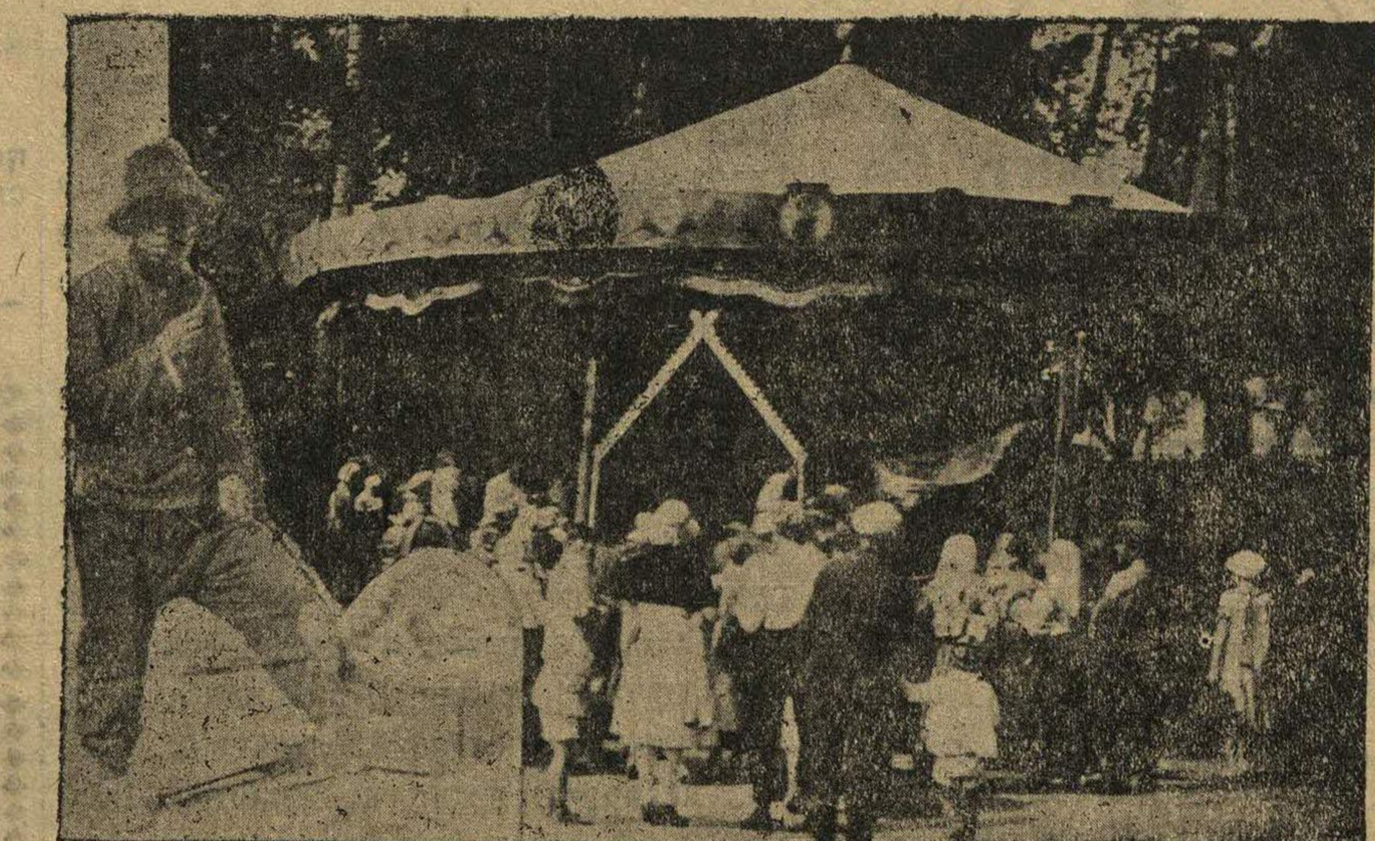
Направо — карусель. Слева — китаец, торгующий своими изделиями—веерами, игрушками и т. д.

И эх ма, да вот она, Балахнинска да станция... Ничего, что карусели взвизгивают густые клубы едучей пыли, публике все нипочем, многие откашляваются, отплеиваются, ругаются, но все-таки продолжают стоять и ждать своей очереди на катанье.