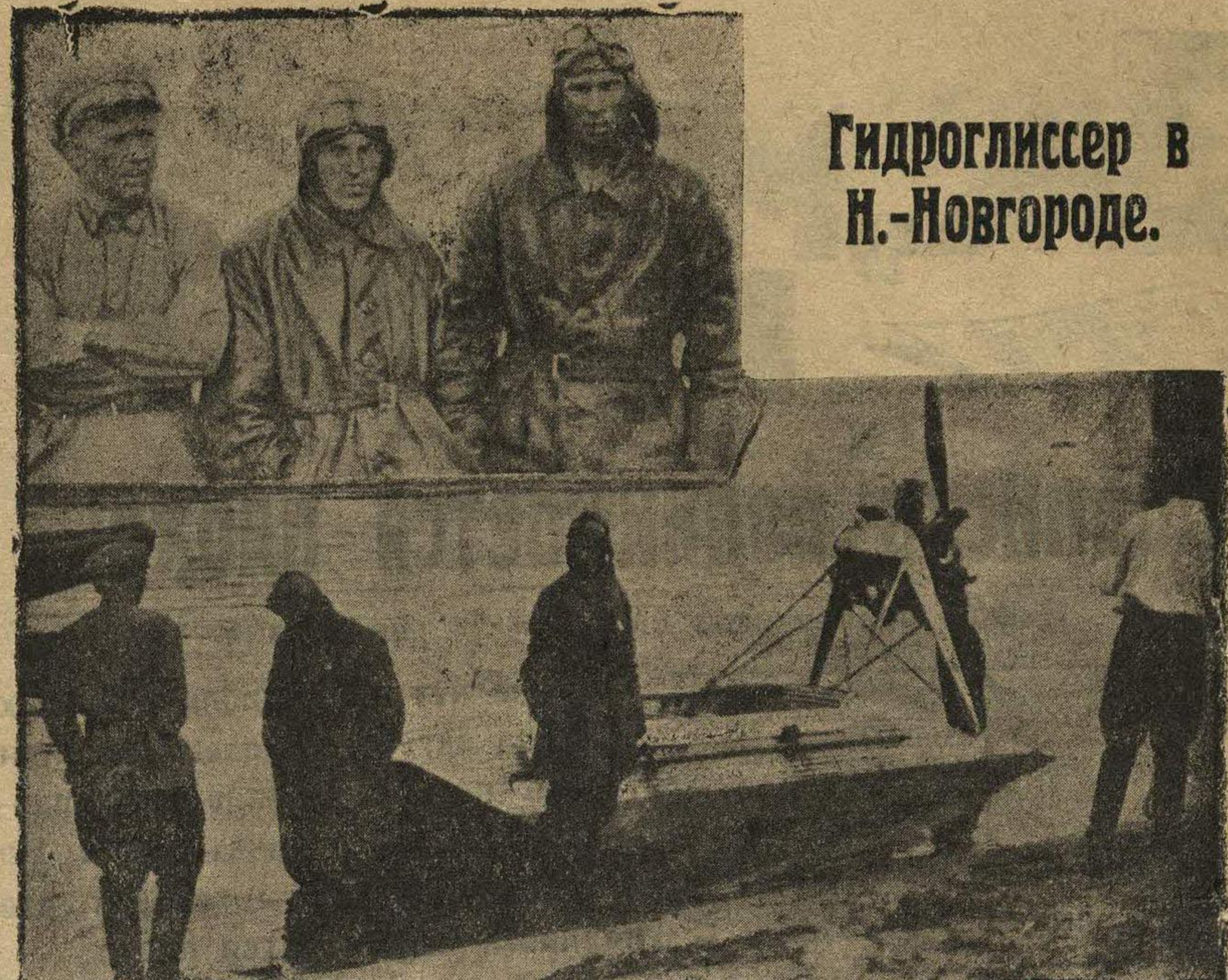
Гидроглиссер в Н.-Новгороде.

Гидроглиссер—авиалодка, она приводится в движение пропеллером, может развить скорость до 80 в. в час.