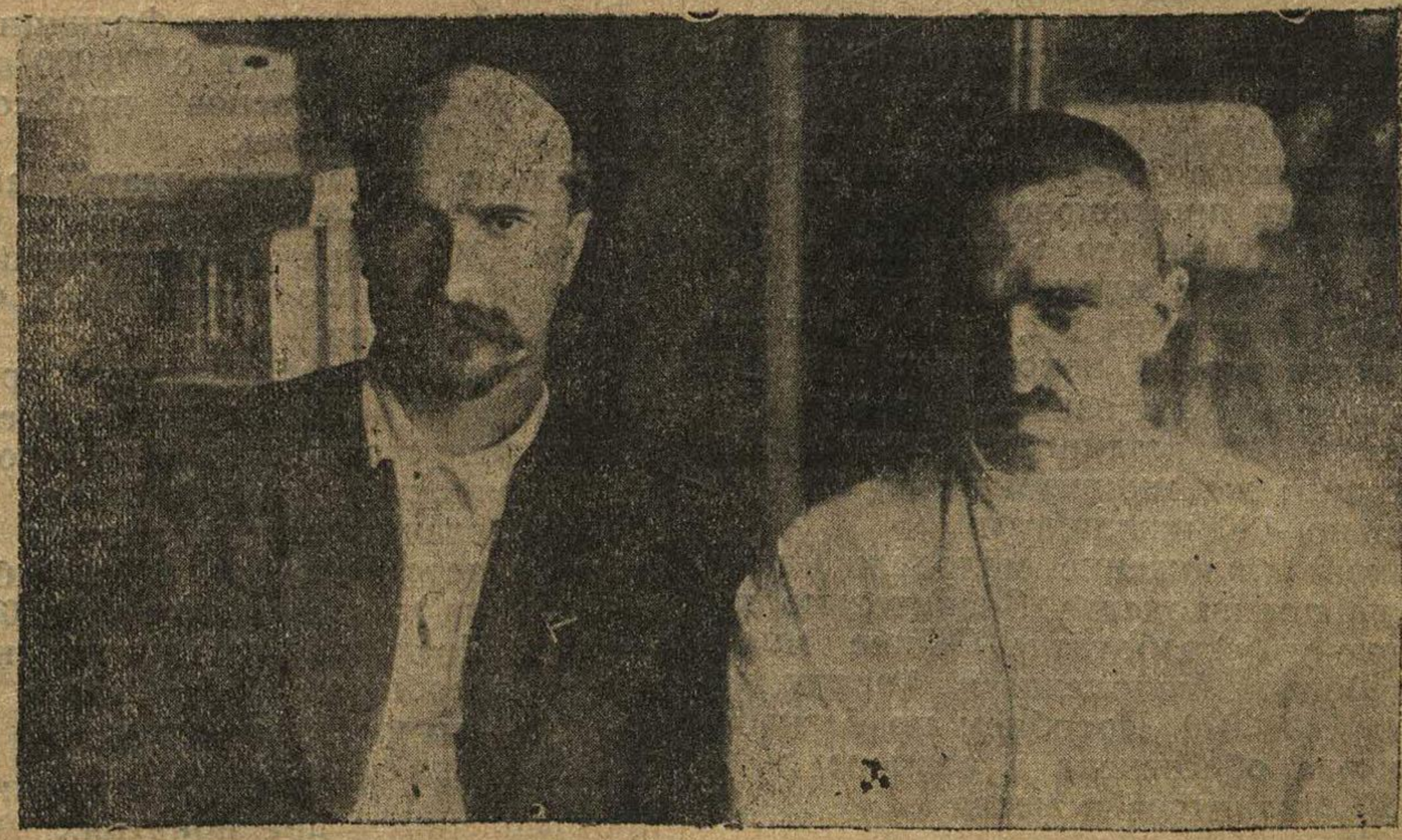
На нашем снимке — Наркомторг СССР т. Миноян, недавно приехавший в Н.-Новгород и пред. Ниж. ГИК тов. Муралов.