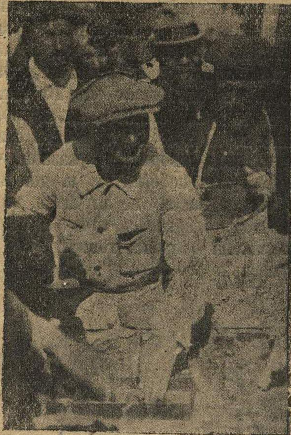
Секретарь ГК ВКП(б) т. Жданов закладывает первый камень.

Мы празднуем сегодня громадное культурное достижение, являющееся показателем нашего хозяйственного укрепления и роста творческой воли и энергии рабочего класса,—вот смысл всех речей.