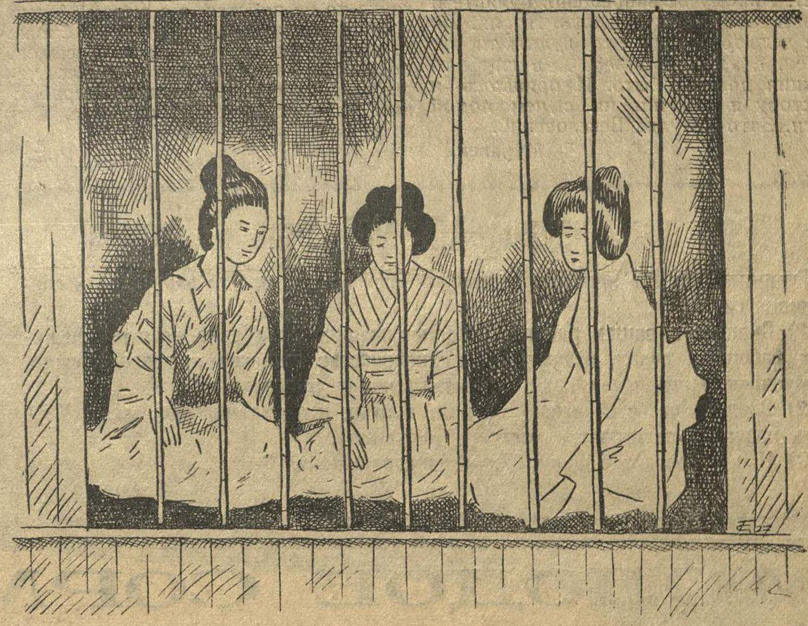
«ЖИВОЙ ТОВАР» ВЫСТАВЛЕН ЗА РЕШЕТКОЙ.

но с приходящими с севера поездками прибывали 3—4 партии (в 40—50 человек каждая партия) молодых крестьянок в возрасте 15—20 лет. Эти партии сопровождали 2—3 мужчины. Начальник станции решал, что здесь что-то неладное. На ноги была поднята тайная полиция.