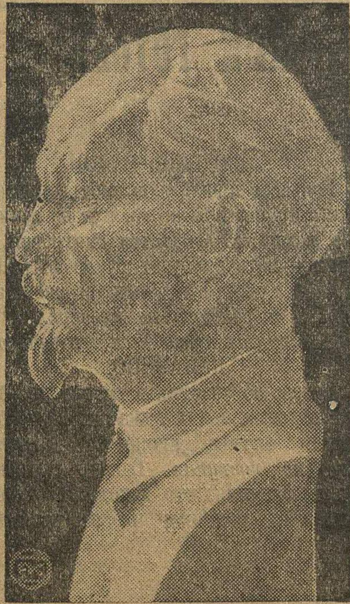
Бюст Ф. Э. работы скульпторши С. Лебедевой.