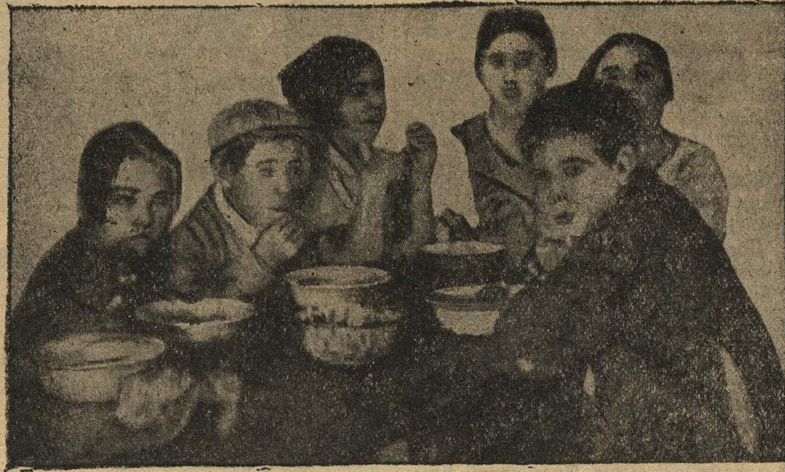
В общежитии школы фабрики. За обедом.

Не нужно надеяться на то, что ктонибудь придет и переделает жизнь в общежитии. Надо браться за это самим и главным образом через свою комсомольскую ячейку.