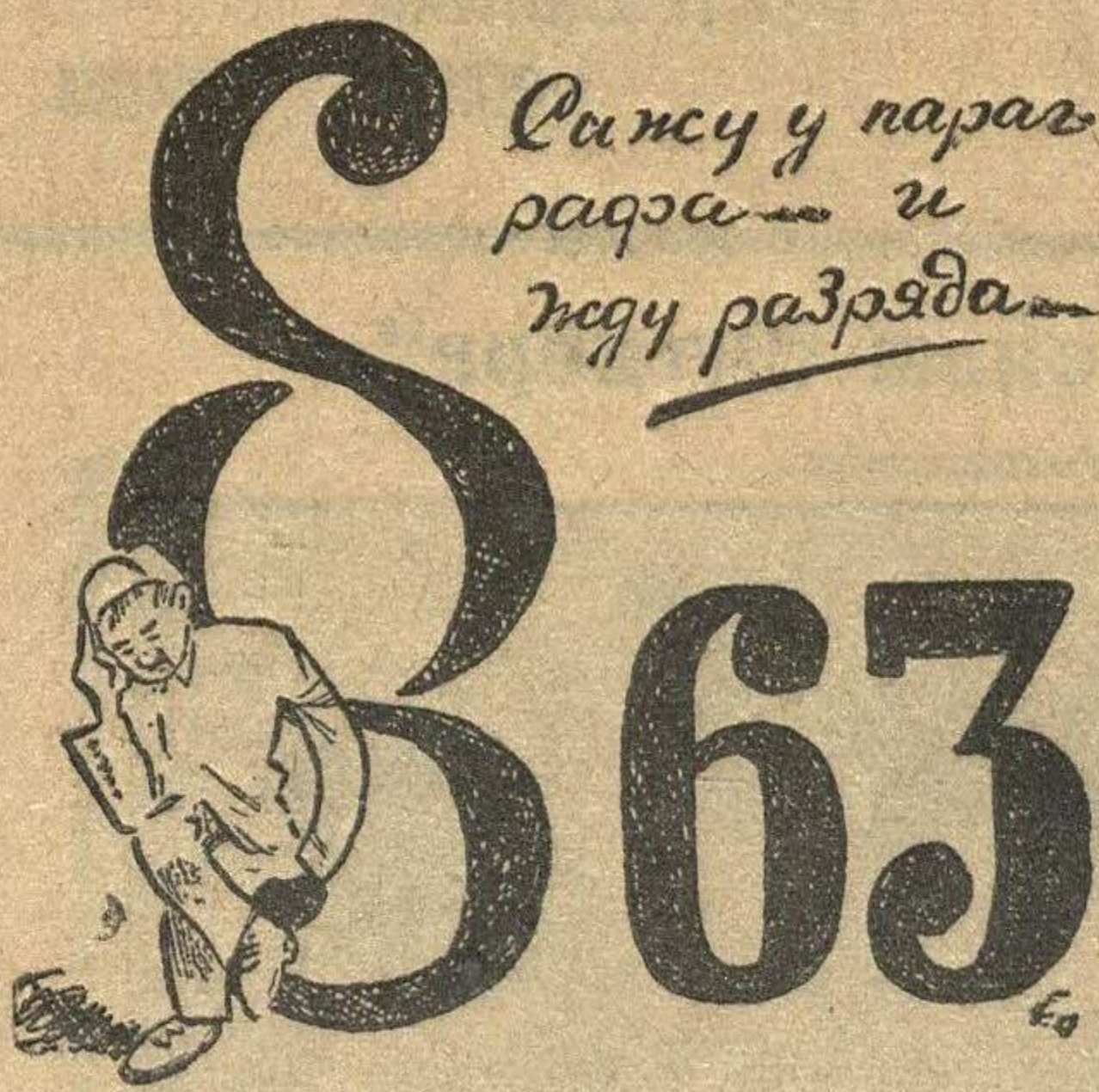
Виджу у параз разра и виджу разряда

В колдоговоре, в § 63, в первом примечании сказано: «Подростки, поступающие на горячее и вредное производство, оплачиваются по 2-му разряду». В октябре 1926 г. в Сормовскую школу ФЗУ было принято 20 человек литейщиков. При утверждении колдоговора ребята стояли за примечание § 63. Параграф прошел, но ребятам разряда не дали. Ребятам, которые возмущены этим поступком, объясняют это