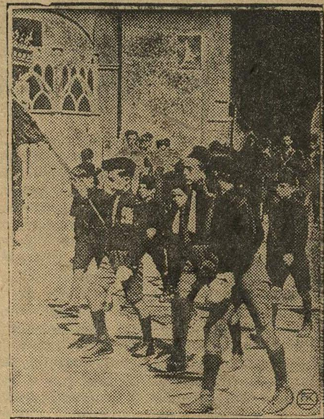
Демонстрация детской фашистской организации в Италии.

ляющую в общей сложности 900 ф. ст., а 783.000 горняков потеряли за тот же период на заработной плате в общей сложности 229.000 ф. ст.