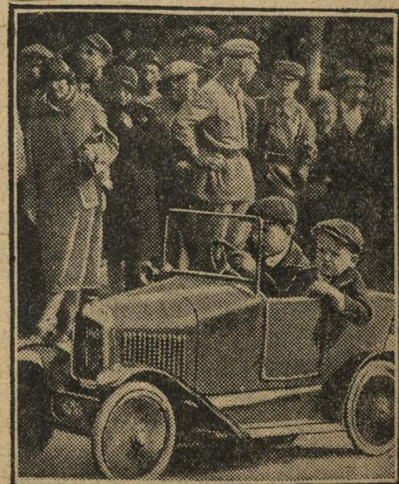
На состоявшихся 18 сентября в Москве автомобильных гонках, уча- ствовали также два юных пионера. На снимке: — Участники пионеры в своем автомобиле перед отправкой.