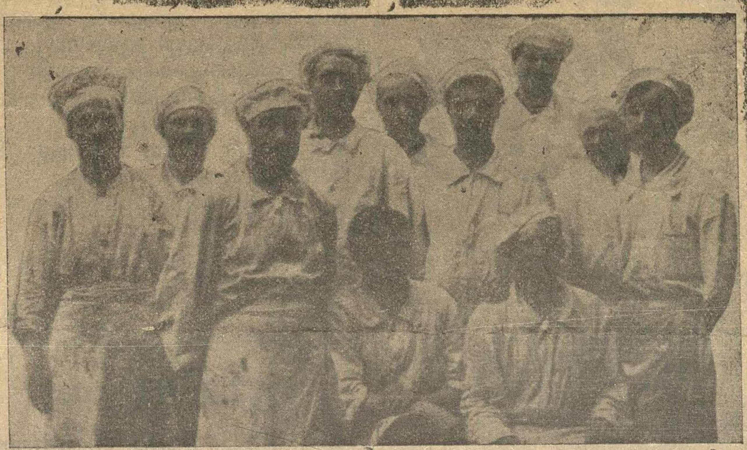
1 октября на кондитерской фабрике «Красный Октябрь» (город) был проведен субботник в помощь беспризорным. На снимке — мастера, принимавшие участие в субботнике.