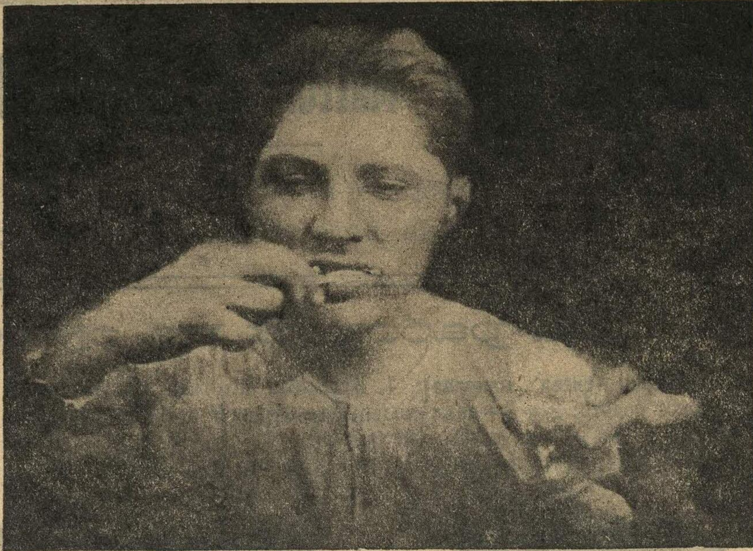
Он каждое утро чистит зубы.