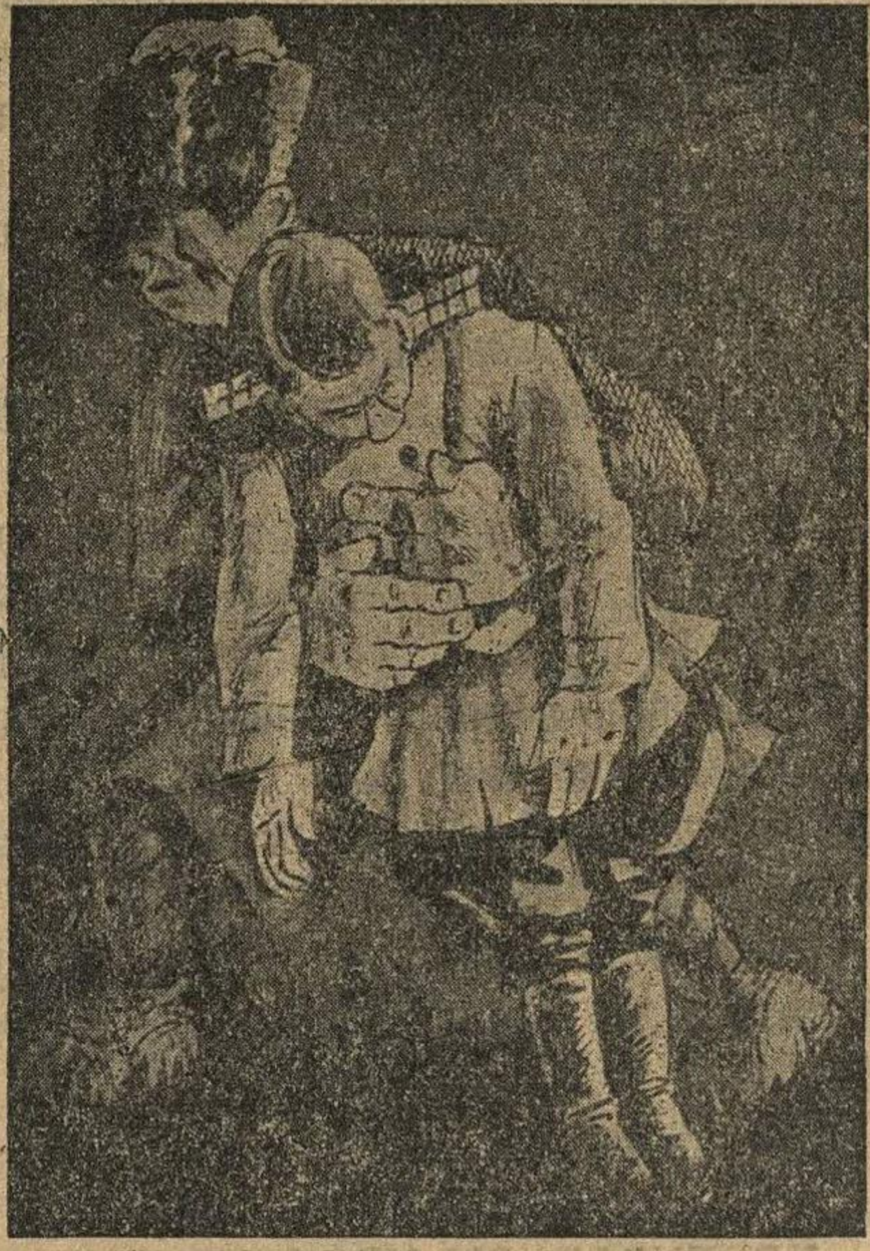
Бельяк нес меня на руках.

Бронесезд резко уменьшил ход и встал, выпустив шипучее облако пара. Где-то с сухим треском шелкали тя- желые градины... стреляли. Выглянул в окно Кунин, увидел, что поезд сто-