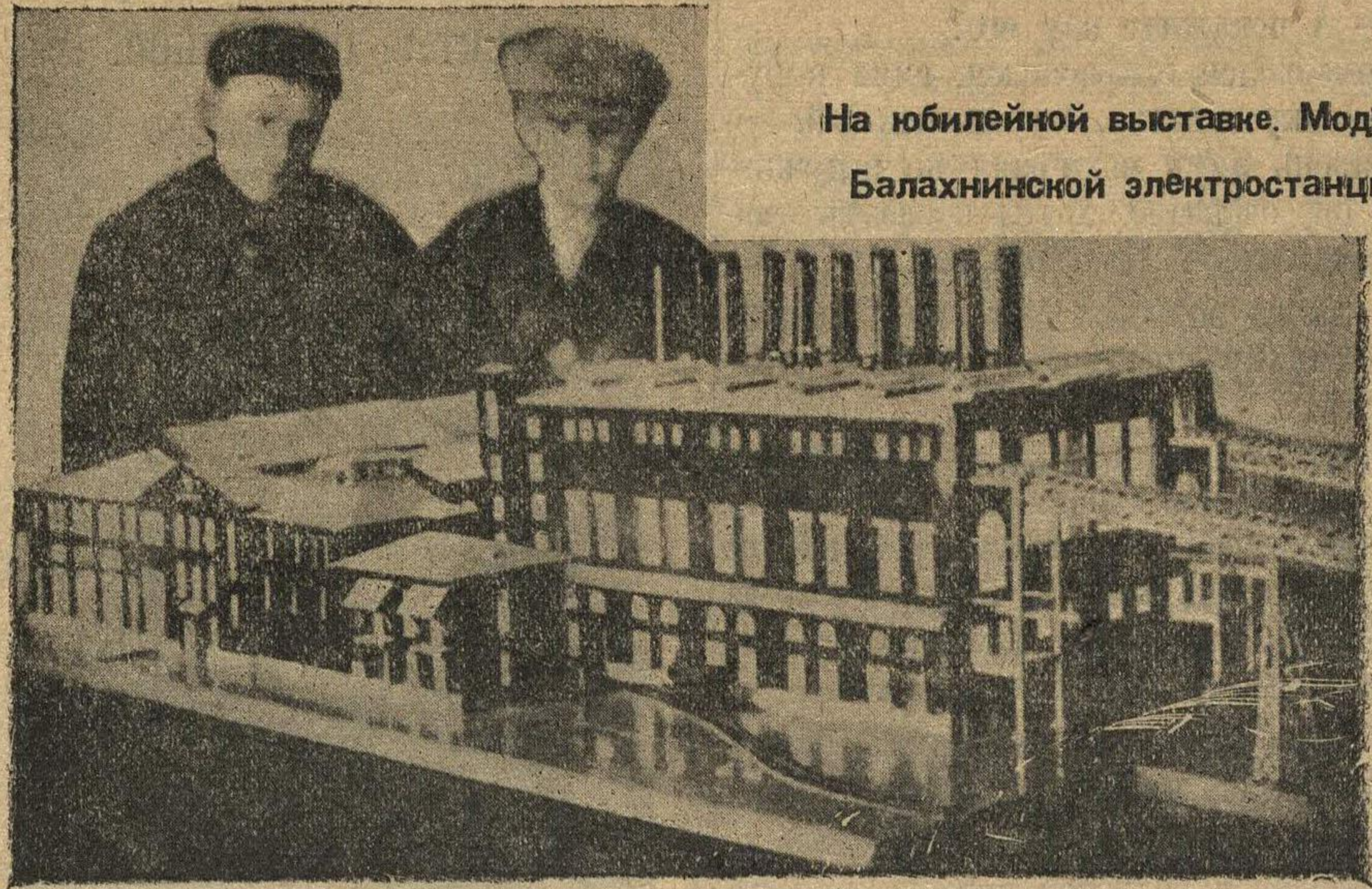
На юбилейной выставке. Модель Балахнинской электростанции.

«Образ важен тем, что он в тысячу раз сильнее дает себя чувствовать, чем какое-либо рассуждение».