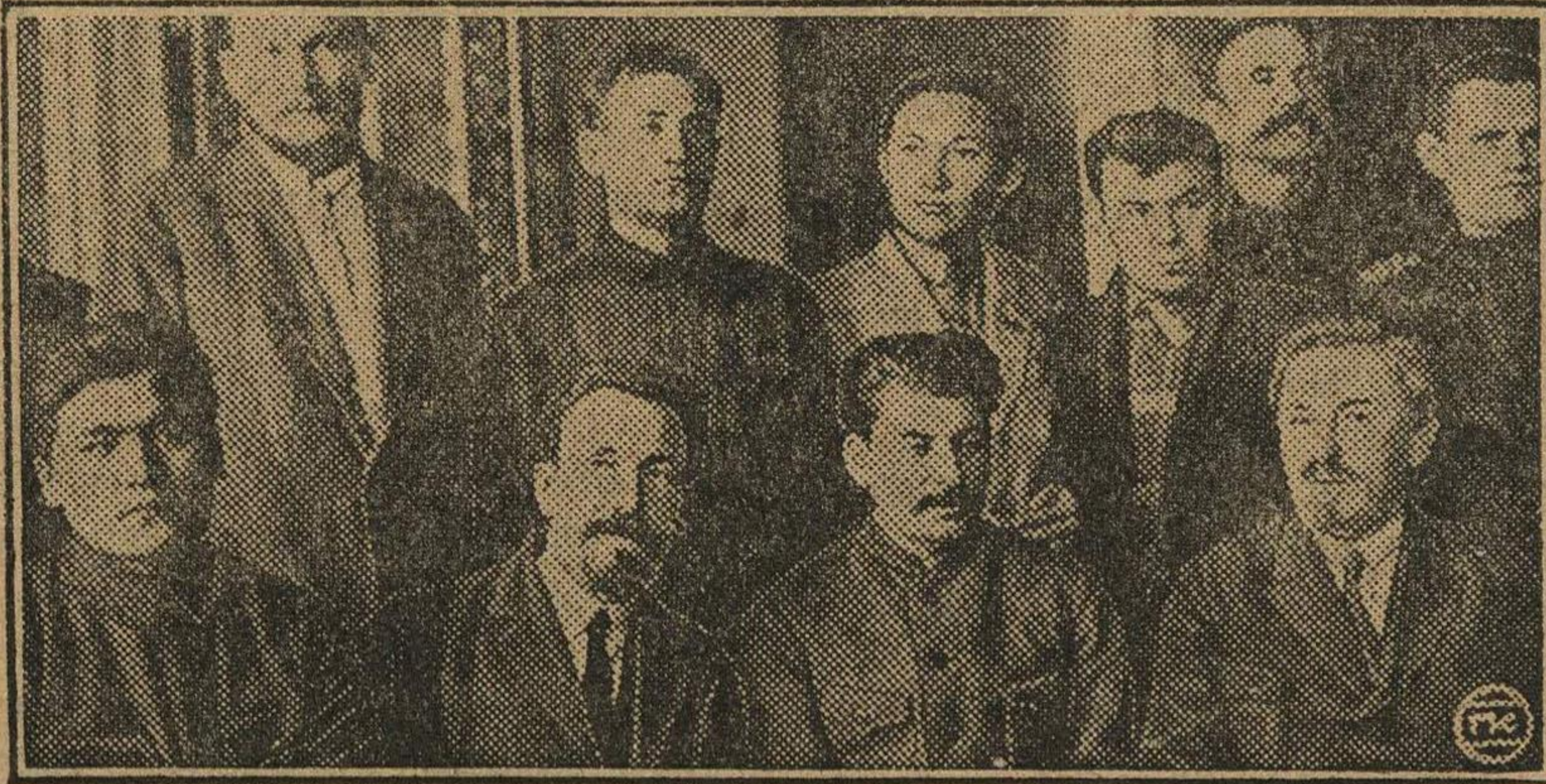
Тов. Рыков (второй слева) и т. Сталин (третий слева) среди делегатов с'езда.