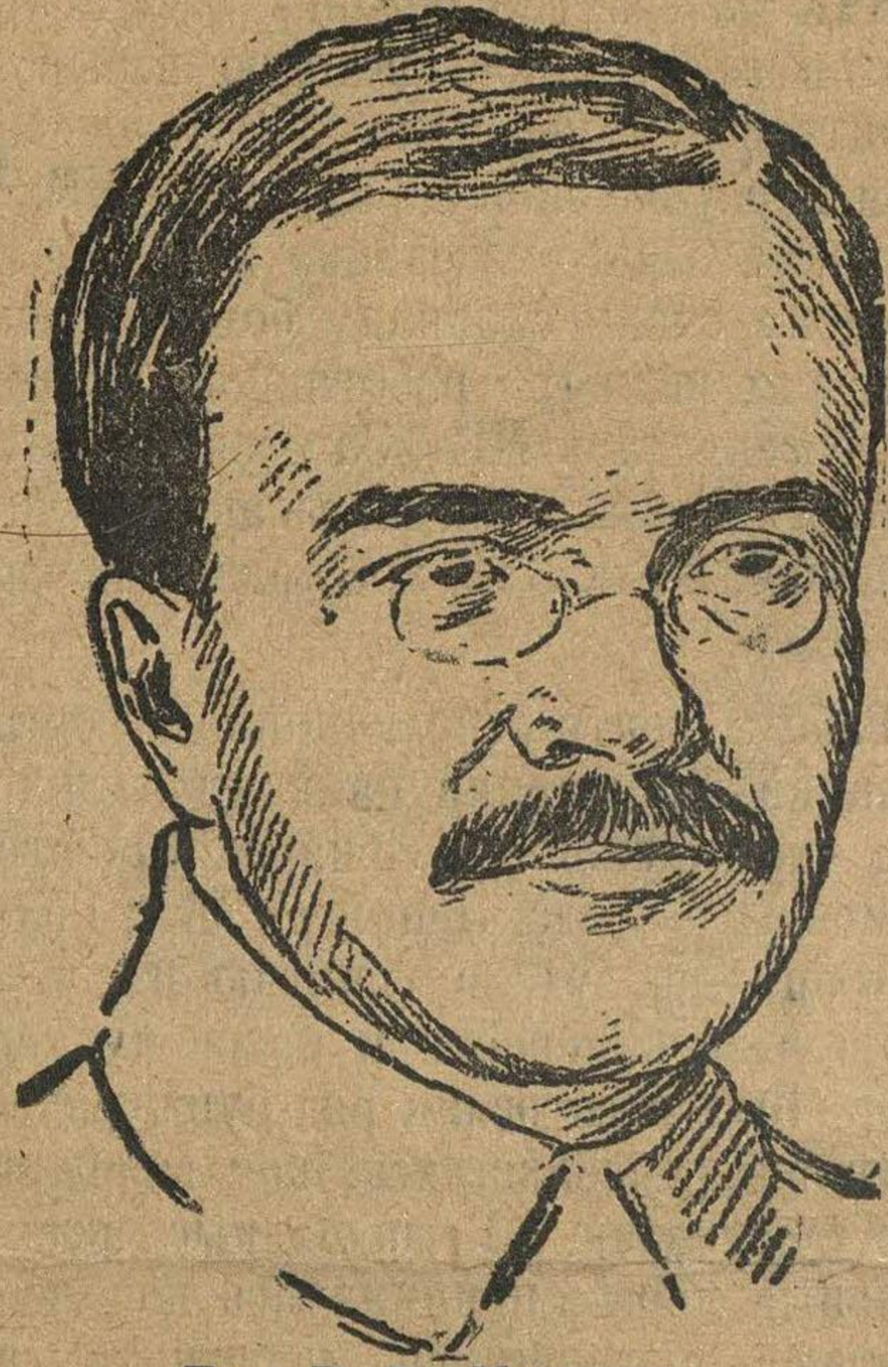
Тов. В. М. Молотов.

Крестьянин это прекрасно понимает. Поэтому он так честит, ругает нас, когда он видит, что наши планы снабжения и заготовки недостаточно гибки.