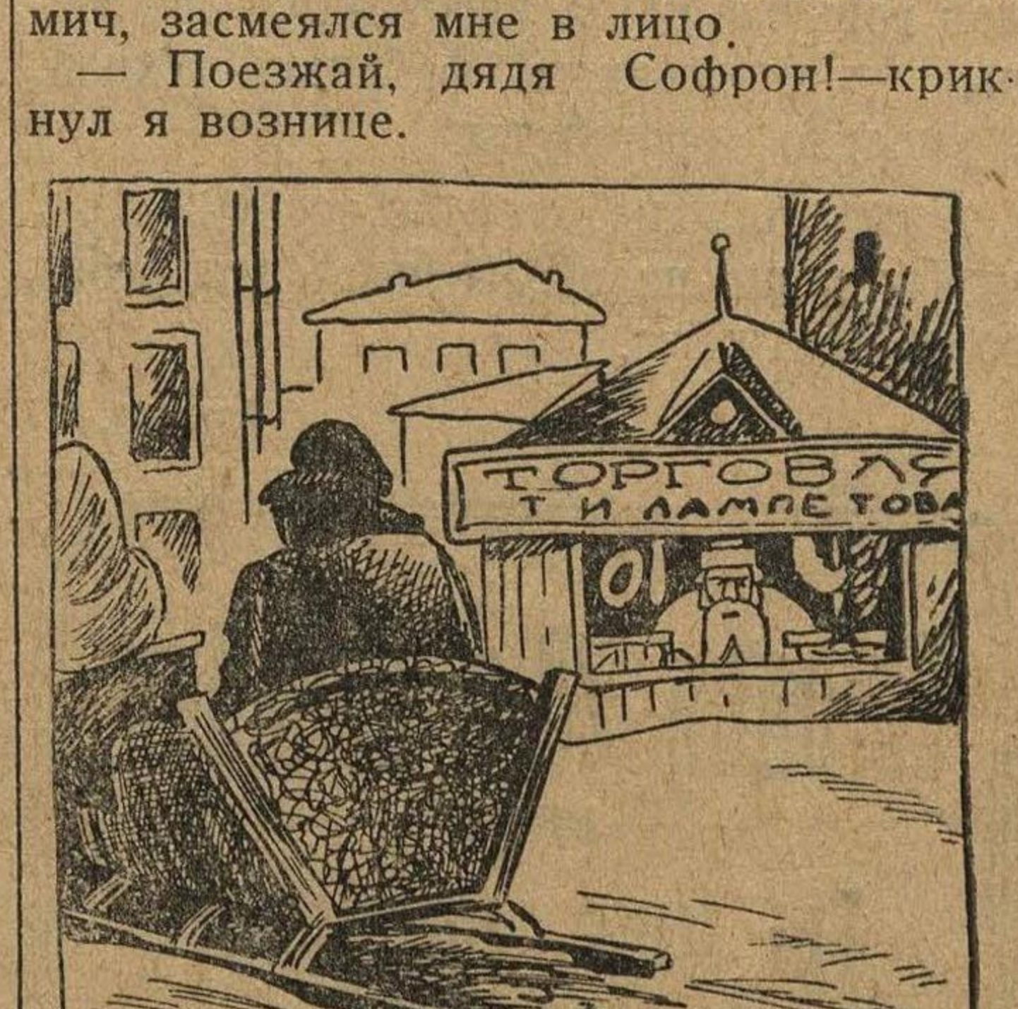
Улыбнулась приветливая вывеска — торговля Лампетова.

— Поезжай, дядя Софрон! — крикнул я вознице.