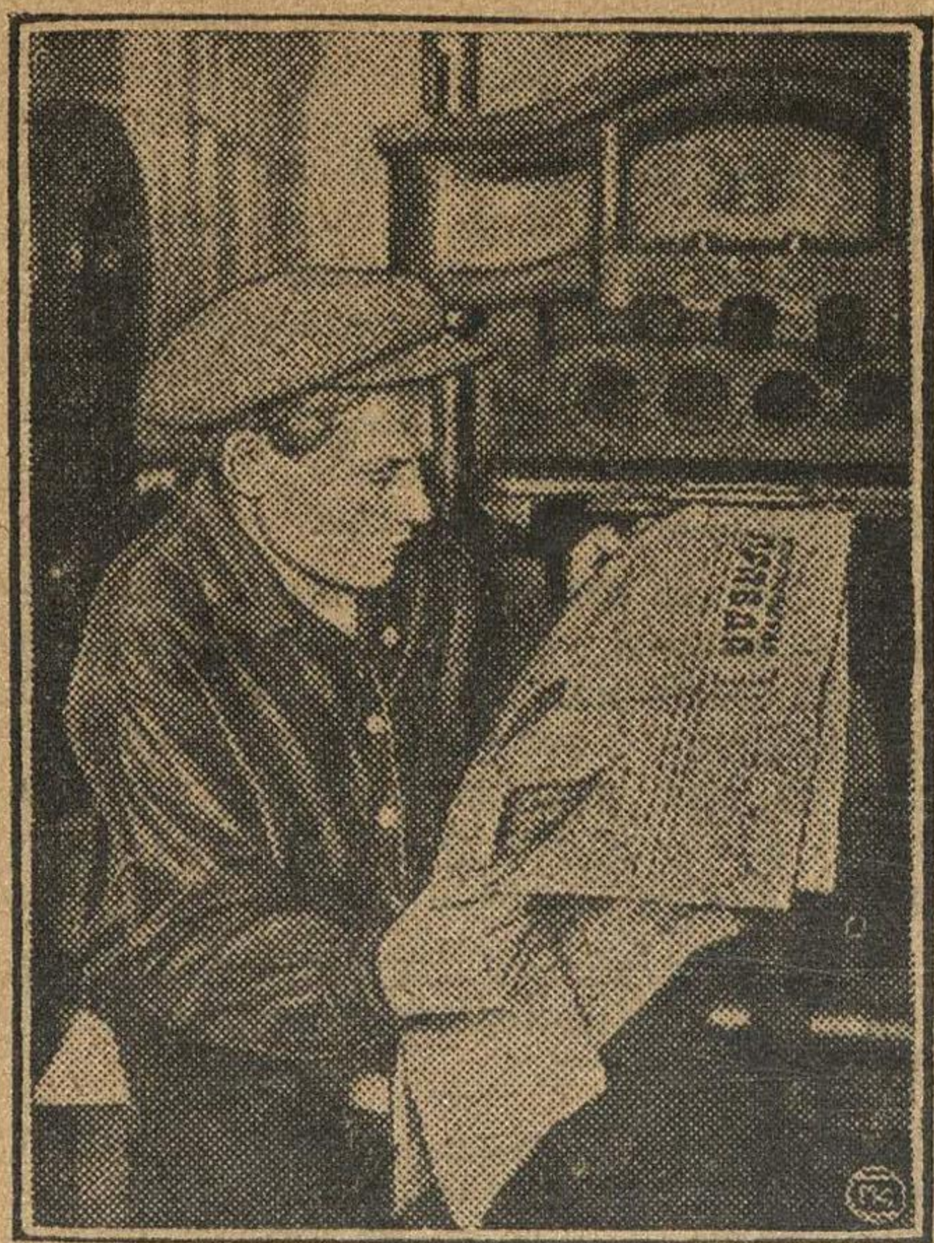
Обеденный перерыв с пользой.

И совсем незаметно пролетел час, гудок уже призывает занять свои места, приняться за работу.