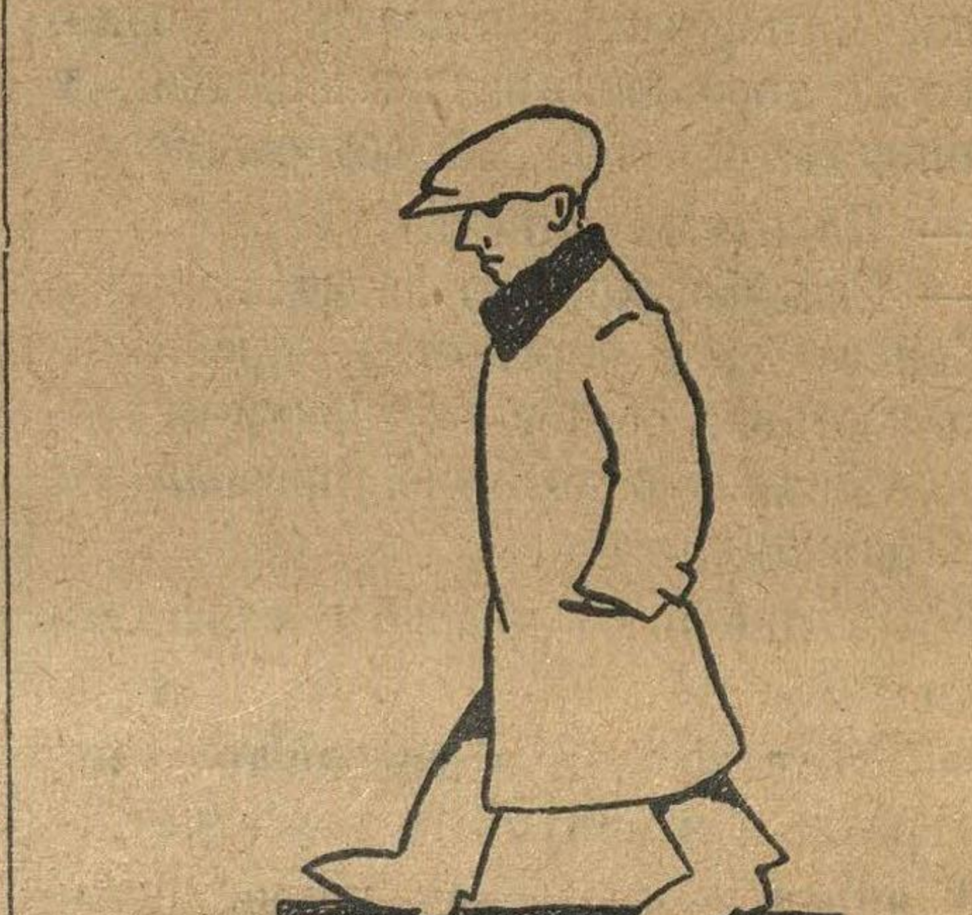
КАК ЖЕ ОДЕВАТЬСЯ...

Холод рождает аппетит. Это важно для многих, страдающих плохим аппетитом. Одеваясь несколько легче,