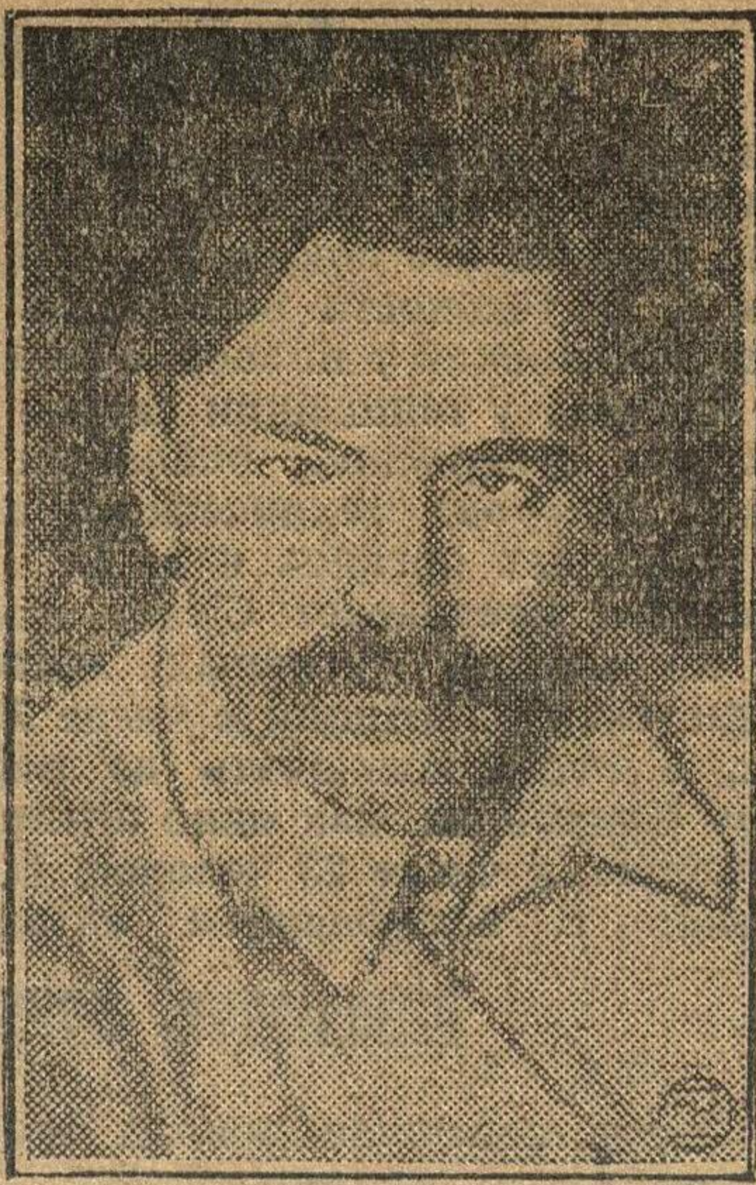
ТОВ. МЕНЖИНСКИЙ В. Р. (Председатель Об'единенного Государственного Политического Управления СССР).

20 декабря 1917 года декретом Совнаркома была организована все-росийская чрезвычайная комиссия по борьбе с контр-революцией и саботажем. За 10 лет своей работы ВЧК, реорганизованная затем в государственное политическое управление, заслужила сильнейшую, ядовитую ненависть наших врагов и горячую благодарность и уважение трудящихся. Это и понятно: ГПУ было верным, надежным стражем пролетарской революции от явных и скрытых врагов. Сразу же после создания ВЧК ей пришлось взяться за большую работу.