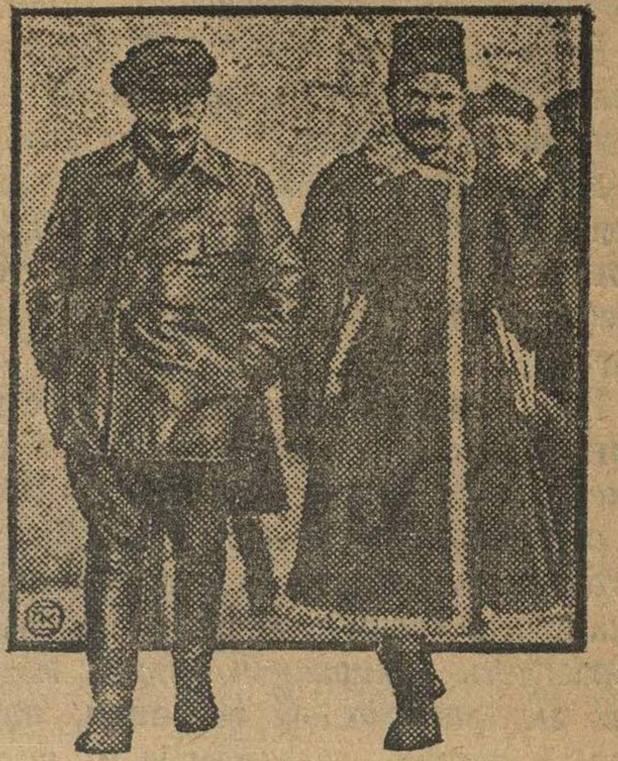
Тов. Бухарин (слева) в группе делегатов идет на заседание.

После принятия с'ездом резолюции по отчету ЦК в комиссию поступило