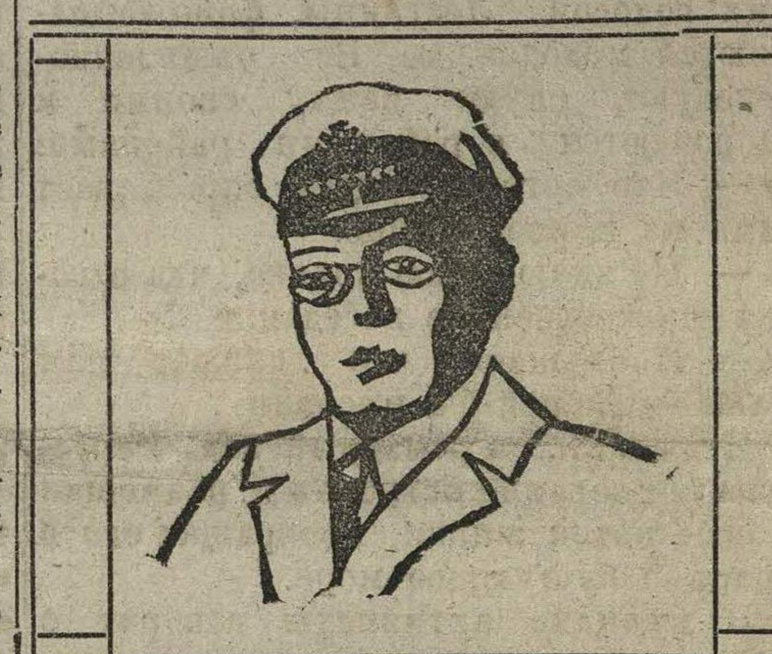
Комиссар морск. сил Республики.