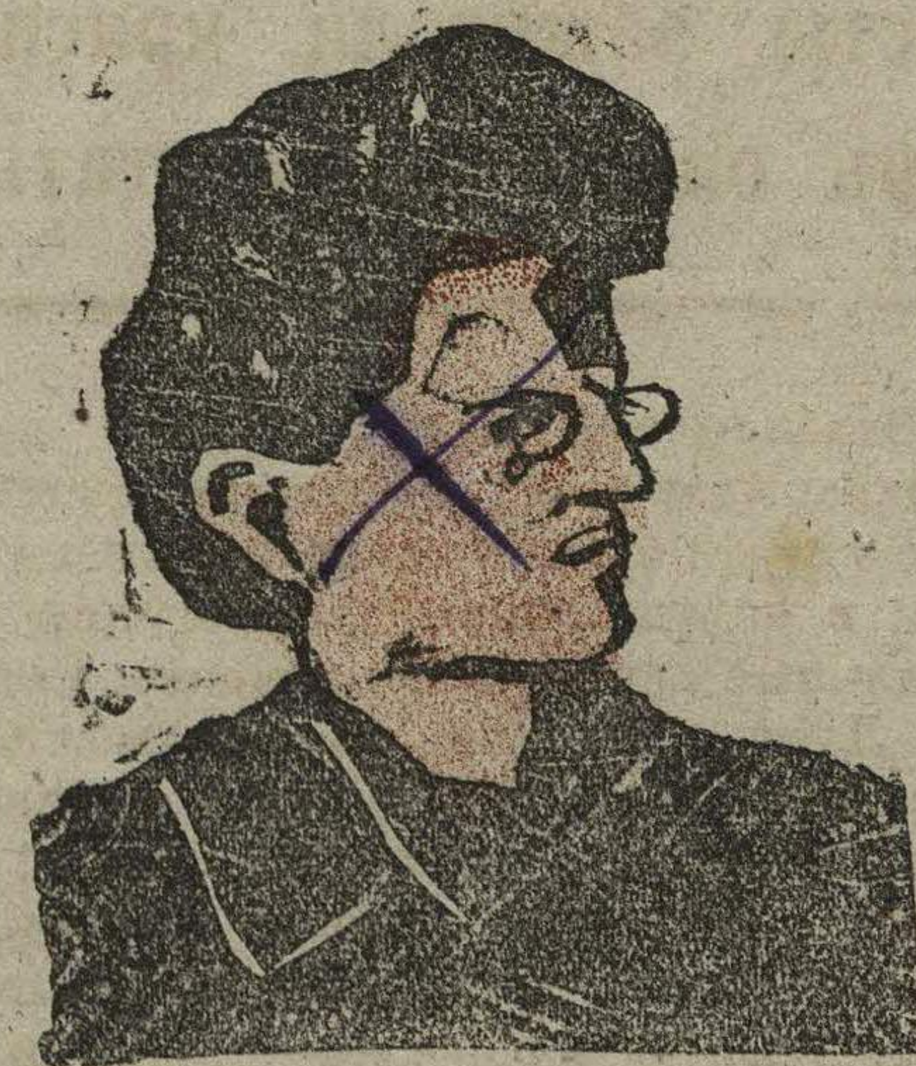
Л. Д. Троцкий.

денной восприимчивостью. Старые военные с удивлением наблюдают, как быстро нынешний красноармейский молодежь научается грамоте по сравнению с повобранцами царской армии. Иные же жалуются и выучке, народных масс и есть пока что, главнейшее завоевание революции. На этом завоевании будем далее строить во всех областях. Правильно поставленная система допризывной подготовки в связи с разумно построенной системой обучения и воспитания в самой армии должна уже в ближайшие годы обеспечить нам резкое повышение квалификации всей армии, а тем самым и ее способность в минуту необходимости вобрать в себя миллионы мобилизованных.