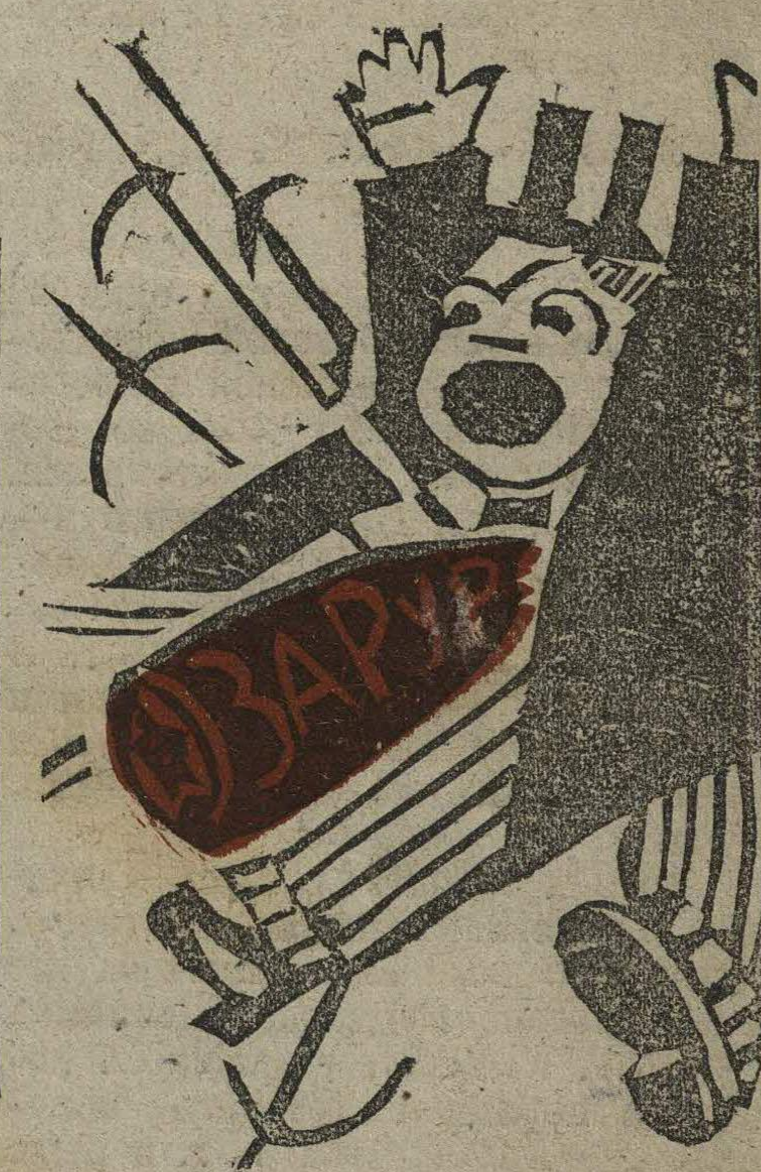
... международной буржуазии Юбилейный подарок.

Вторая задача — техника. Каковы здесь перспективы? Царизм вооружал свою армию в значительной мере при помощи иностранной техники. Это было в природе вещей, так как царизм сам входил в одну из группировок так-называемого европейского равновесия. На же буржуазия рассматривает—и, пожалуй, не без основания,—как клин нарушающий и подрывающий всякое равновесие капиталистического мира. Следовательно, на прямое содействие капиталистической Европы или Америки в деле нашей военной техники мы рассчитывать не можем. Тем важнее наши собственные усилия в этом направлении. Военная техника зависит от общехозяйственной. Это означает, что чудотворные скачки в области вооружения и вообще снабжения армии исключены. Возможны только систематические усилия и постепенные улучшения. Но это вовсе не исклю-