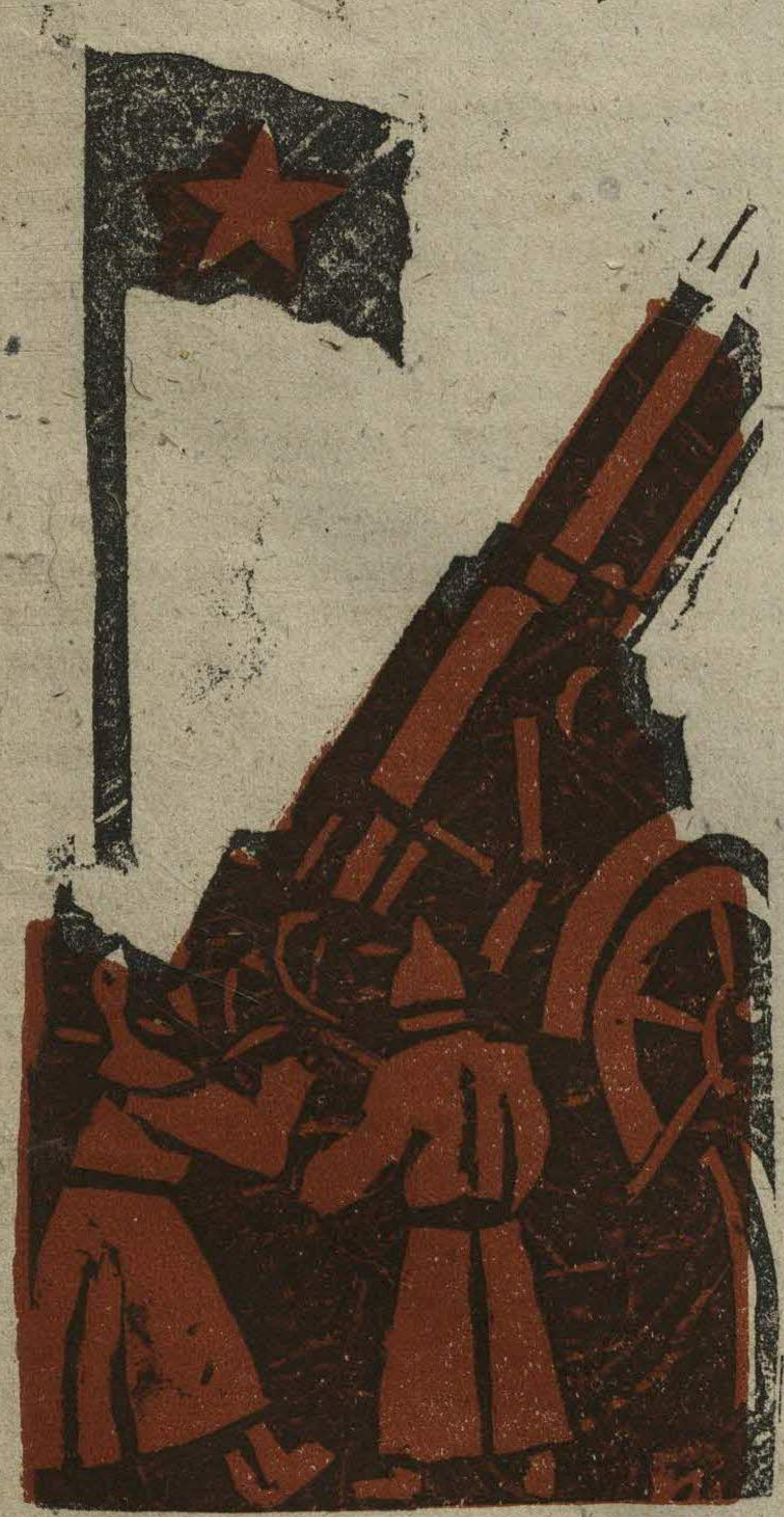
В пятилетнюю годовщину наша Красная Армия готовит...