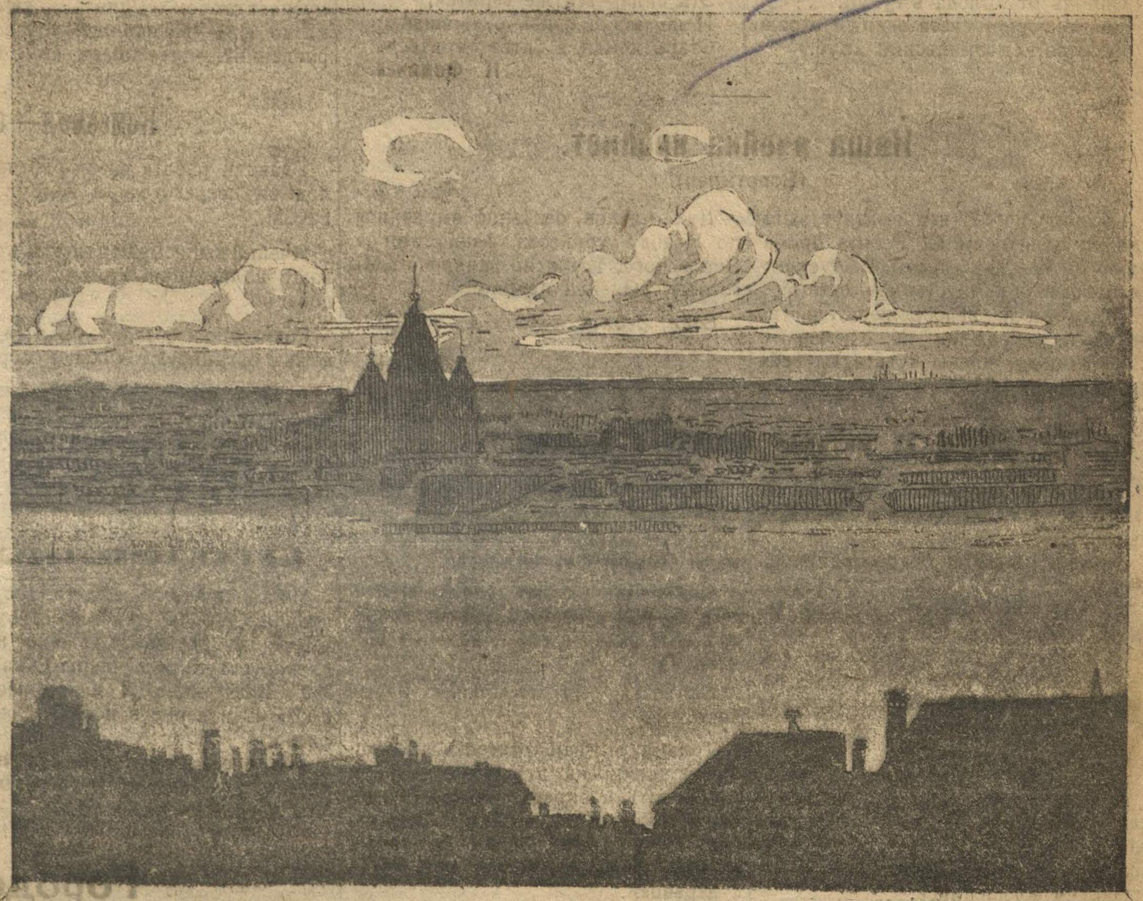
Вид на Оку и Волгу.

1-го августа с. г. в г. Н.-Новгороде 2-й раз открывается Всероссийское торжище — Нижегородская Ярмарка.