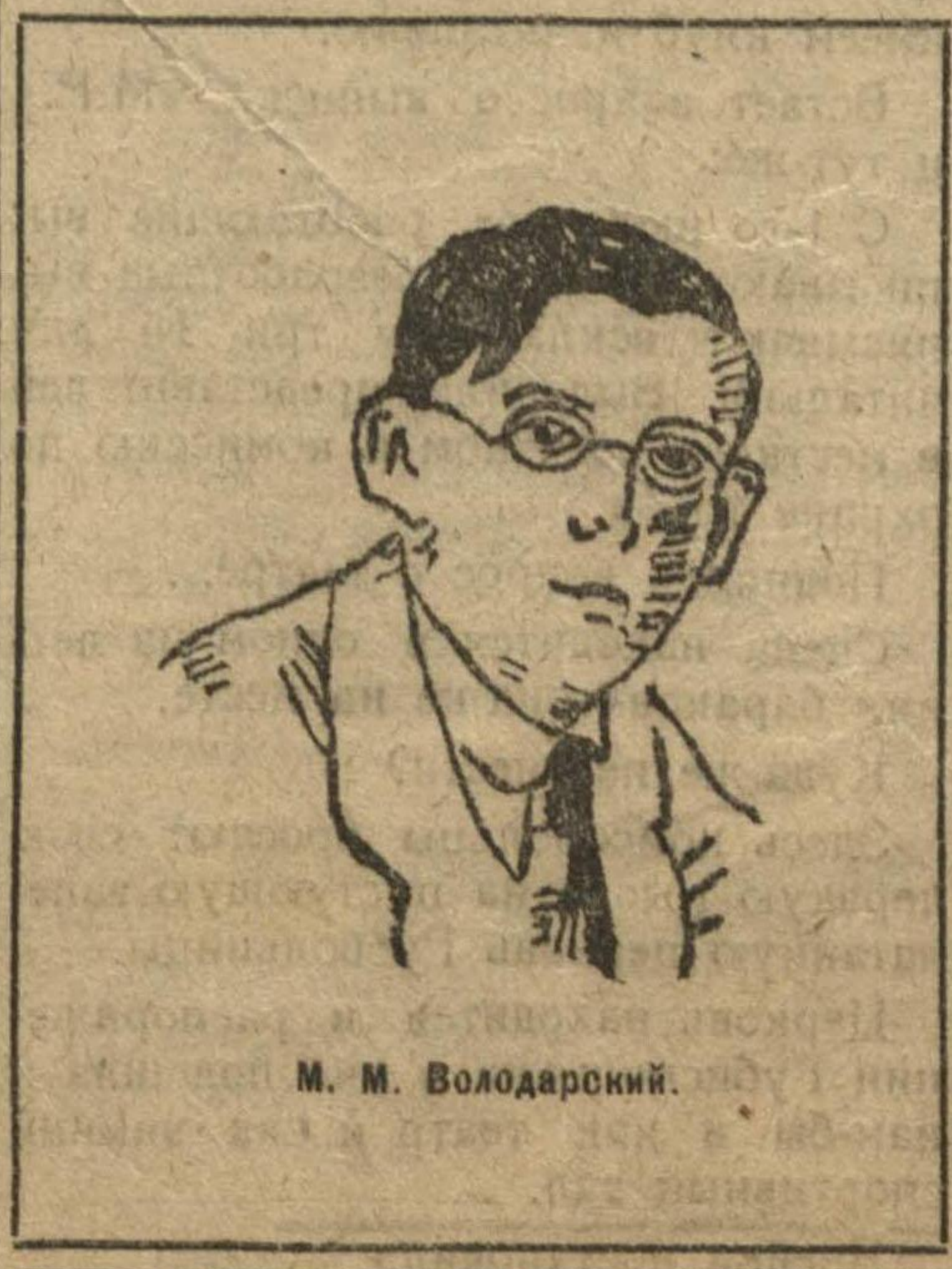
М. М. Володарский.