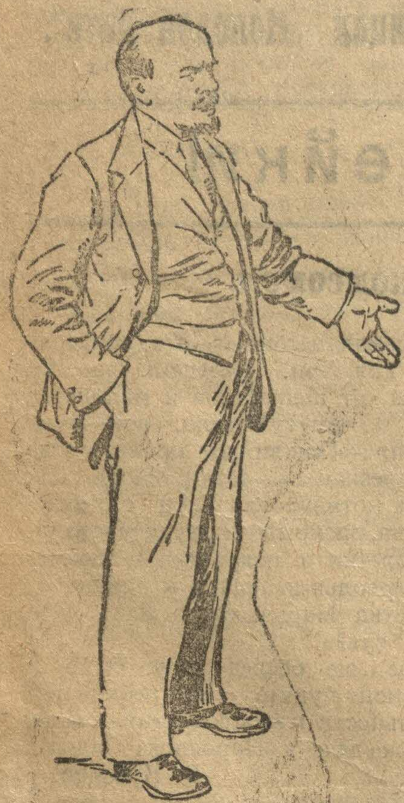
Т. Ленин говорит. «Политике мы научились: с этого пути нас не собьешь и нашей политики теперь должно быть творчеством хозяйственное строительство, подъем всех наших производственных сил».

Всероссийская сессия ЦИК рассмотрела и утвердила союзную конституцию, которая формулирует союз советских социалистических республик, как одно союзное государство.