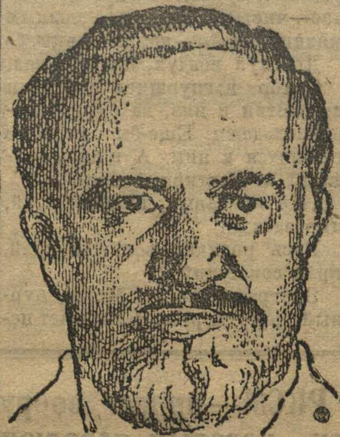
Тов. В. Коларов.

Мы уверены в окончательной своей победе. Гражданская война не кончилась, она будет закончена не иначе, как победой трудового народа.“