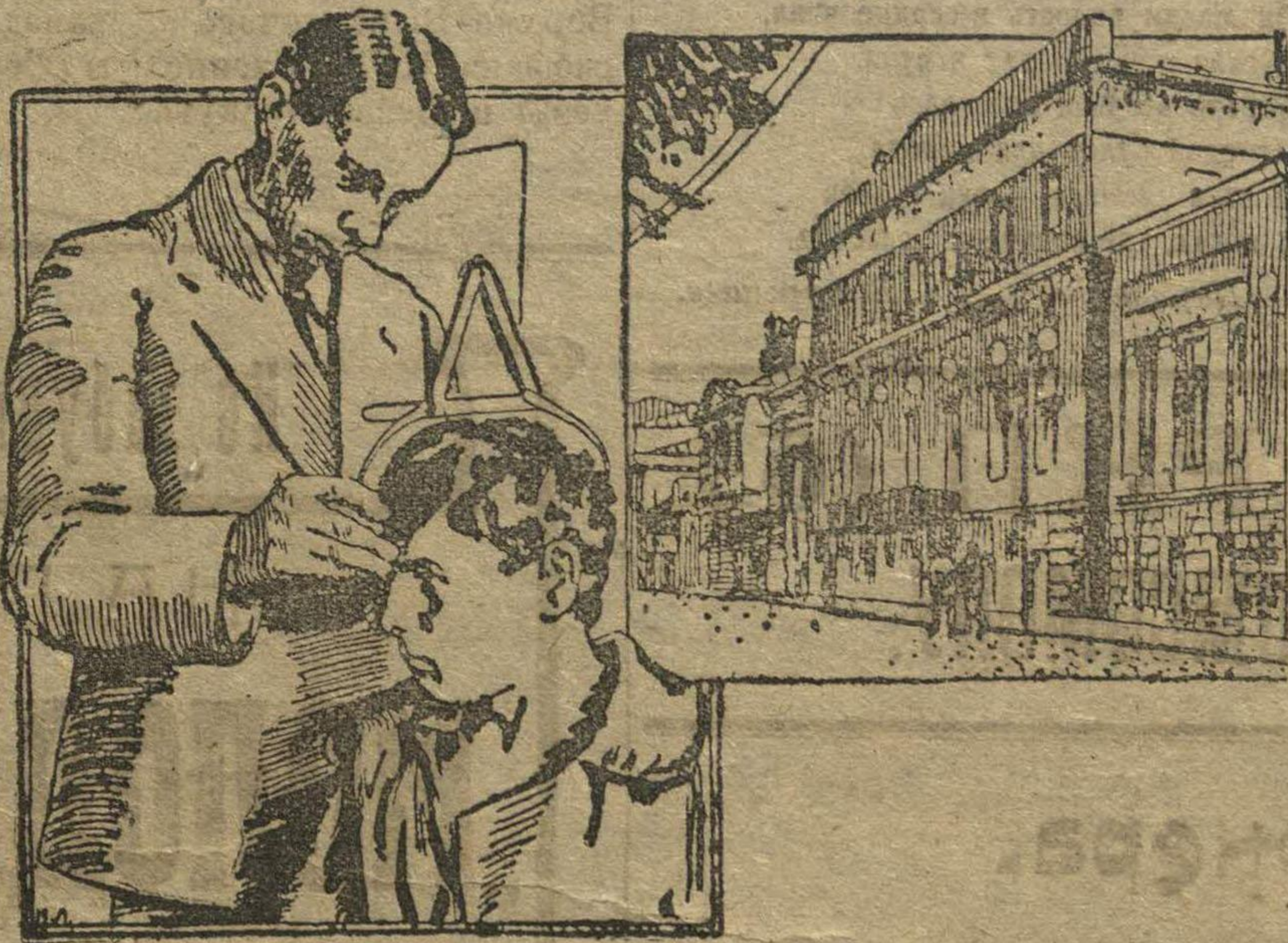
Дом, в котором помещается кабинет.—Измерение черепа преступника.