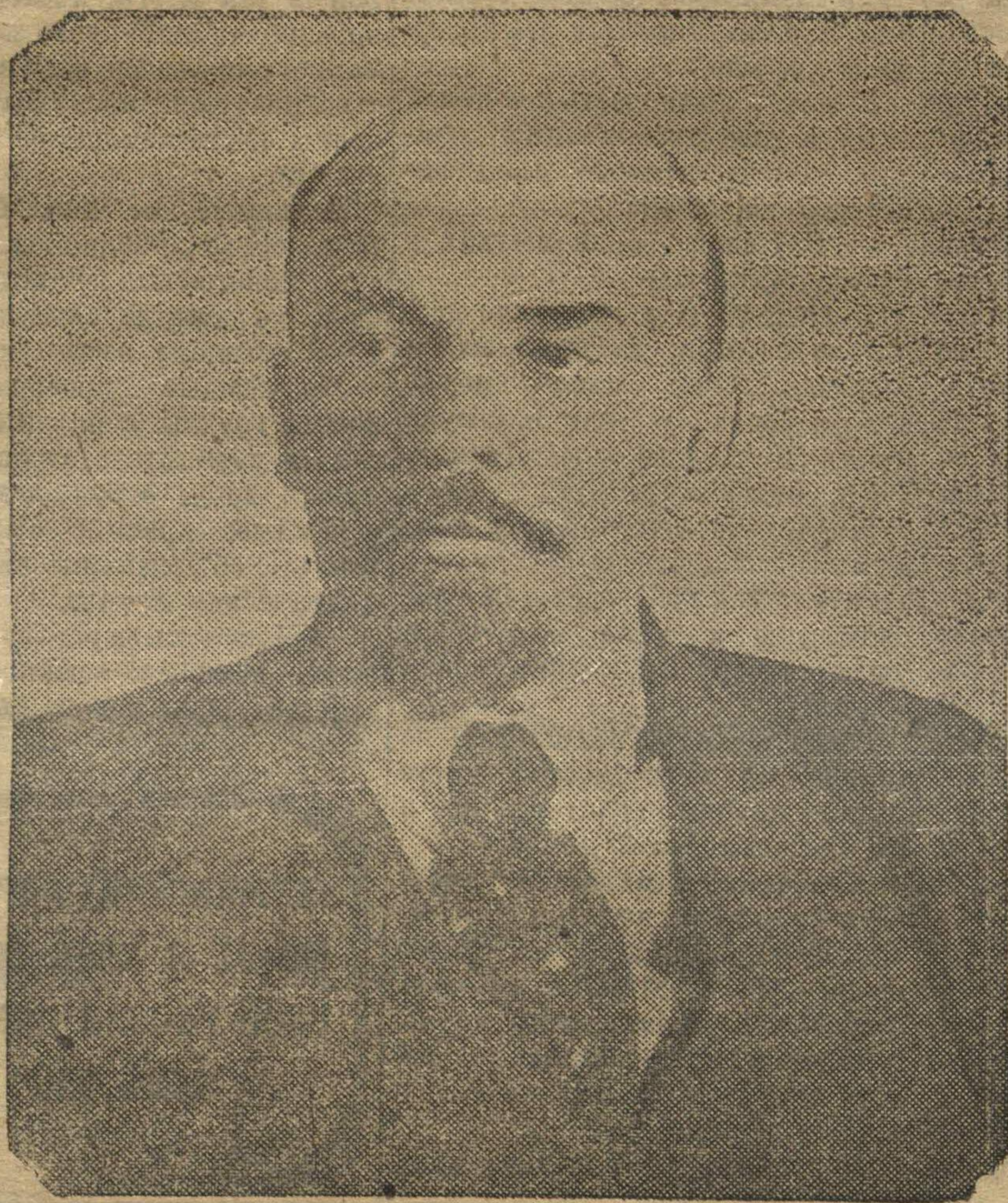
Вождь мирового пролетариата т. ЛЕНИН.

В седьмой год мы ждем революционных бурь на западе! Мы к ним готовы!