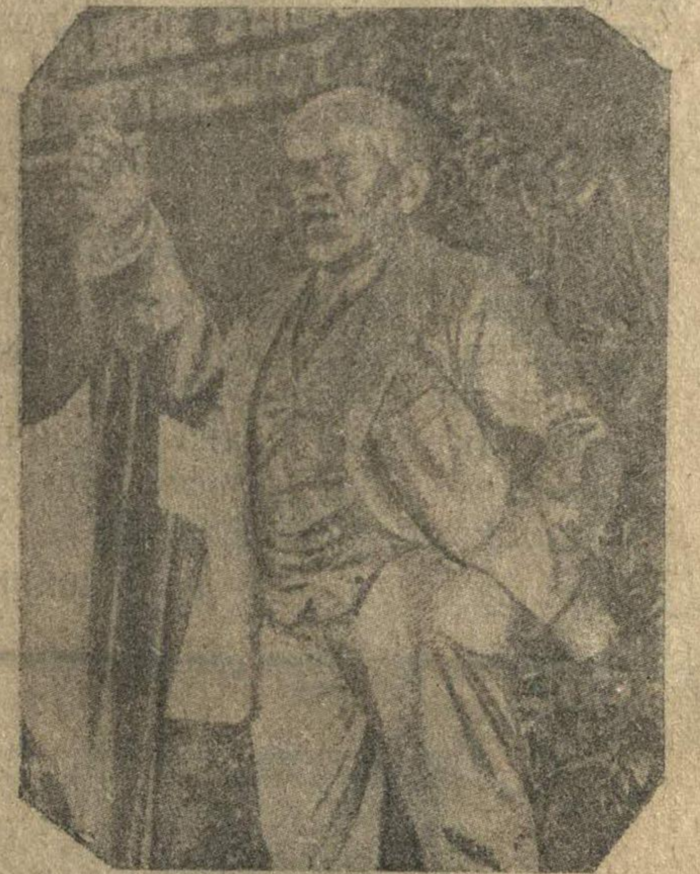
Тот Ленин произносит эту речь.

Придется работать в течение нескольких лет, чтобы усовершенствовать аппарат, изменить его и привлечь новые силы.