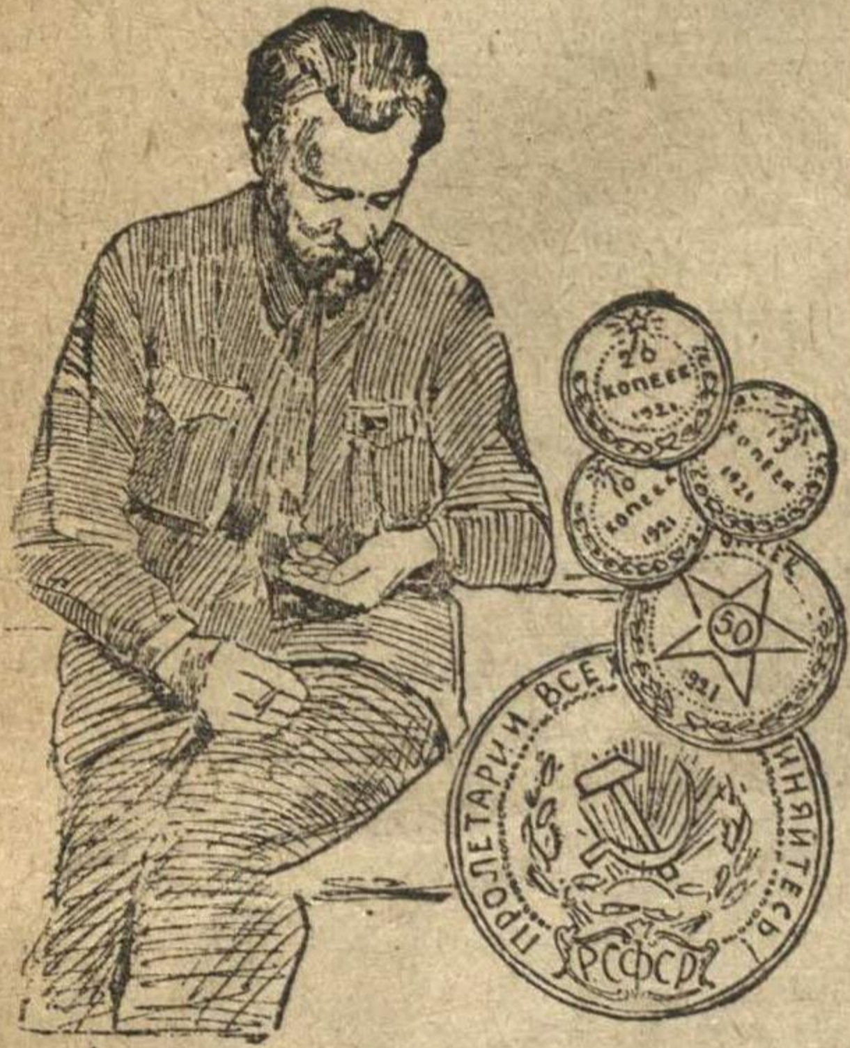
Заместитель Народного Комиссара Финансов тов. БРЮХАНОВ рассматривает новые, серебряные деньги.

Денежная реформа—шаг к победе над буржуазией.—Денежная реформа укрепит союз рабочих и крестьян.—Вред народному хозяйству от падающего в цене совзнака.—Выкуп совзнаков и оздоровление промышленности.—Польза трудящимся с введением устойчивых денег.—Денежная реформа укрепит советскую власть политически.