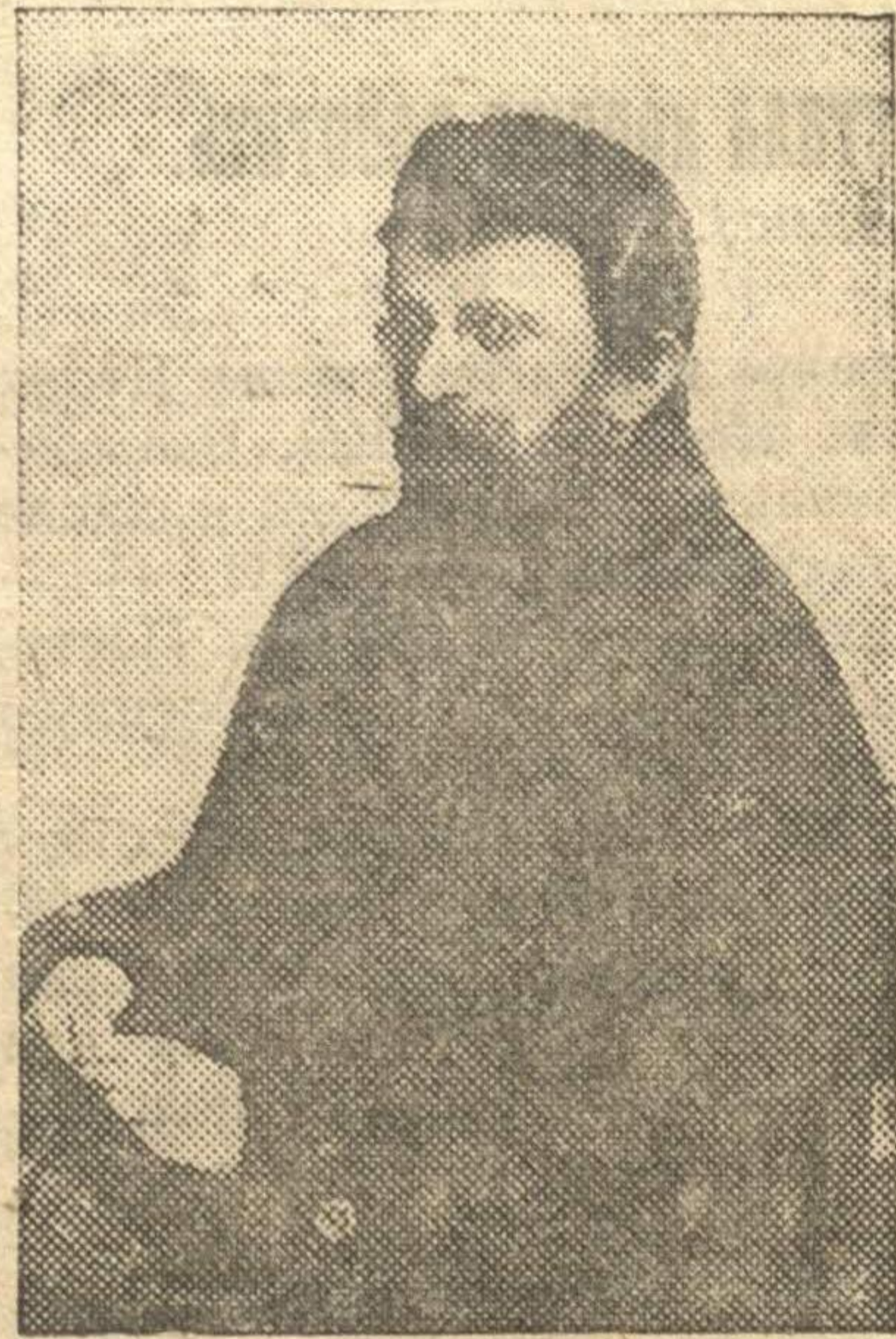
Эрик Мюзам, один из вождей Баварской Советской Республики, заключенный в крепость на 15 л.

(Международное Объединение помощи борцам Революции).