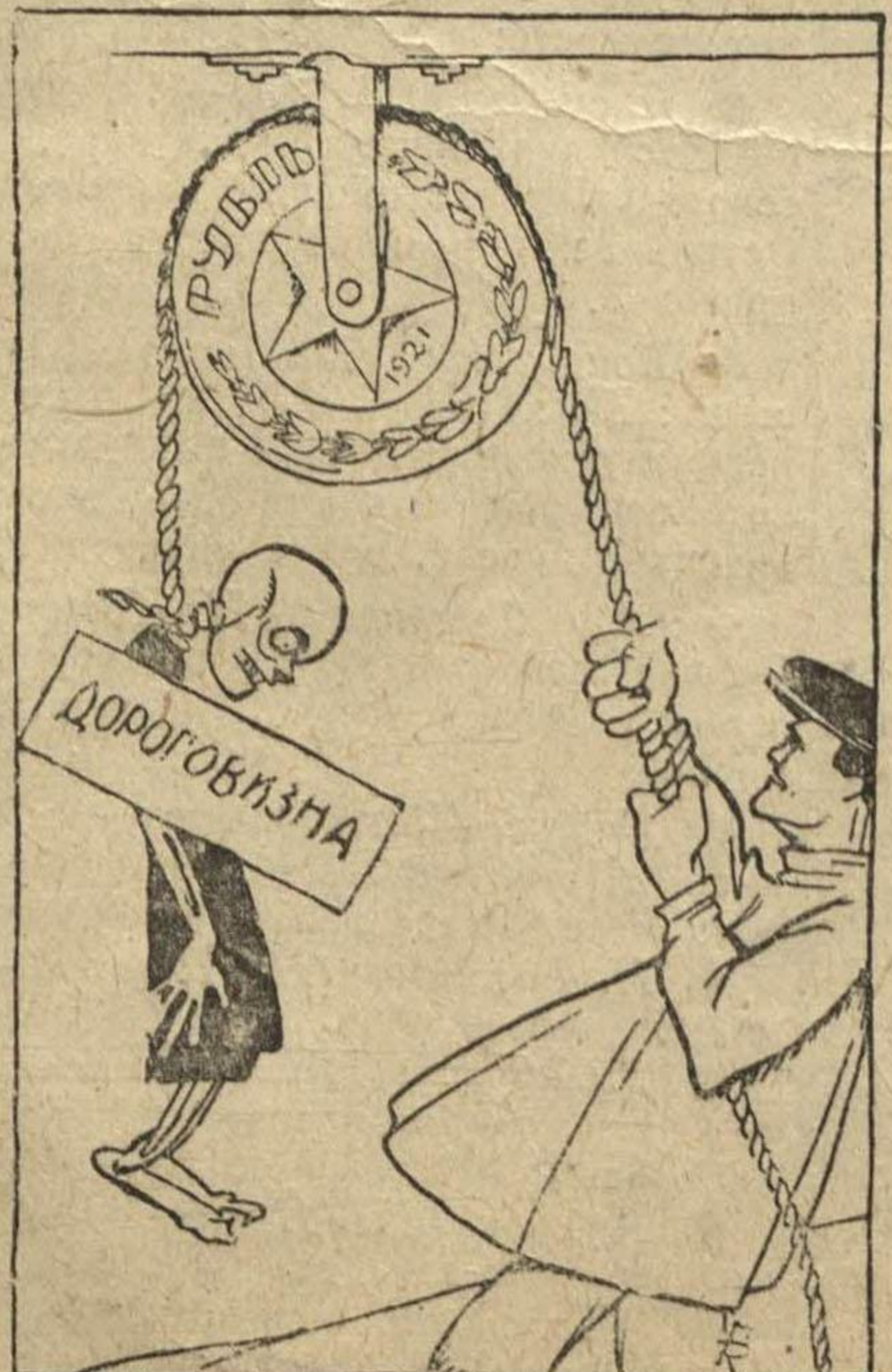
Рабочий — так оно легче будет.

Действие денежной реформы уже сказывается. Цены везде значительно понижены. (Из газет).