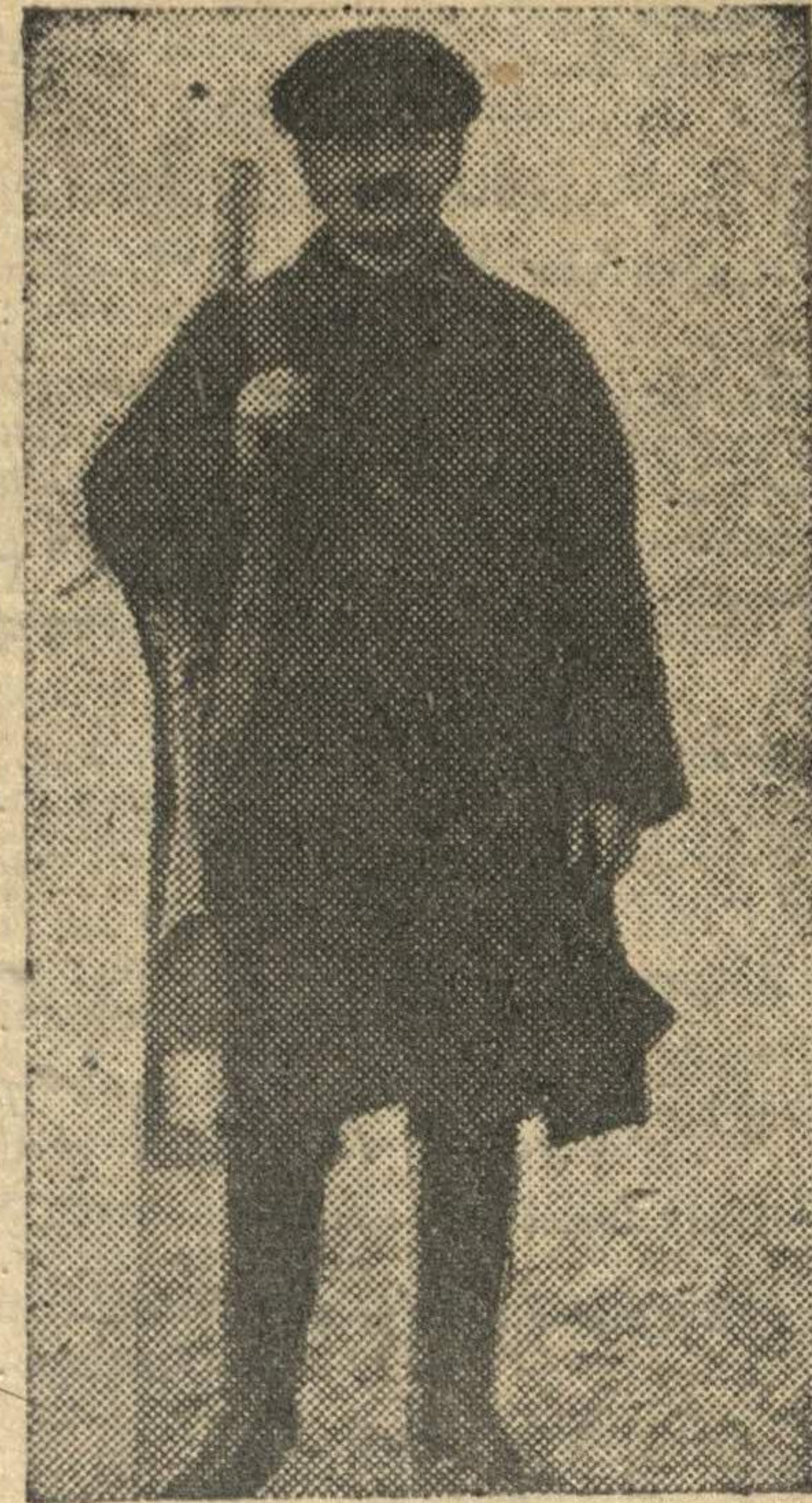
Л. Д. на охоте.—Последн. сним.