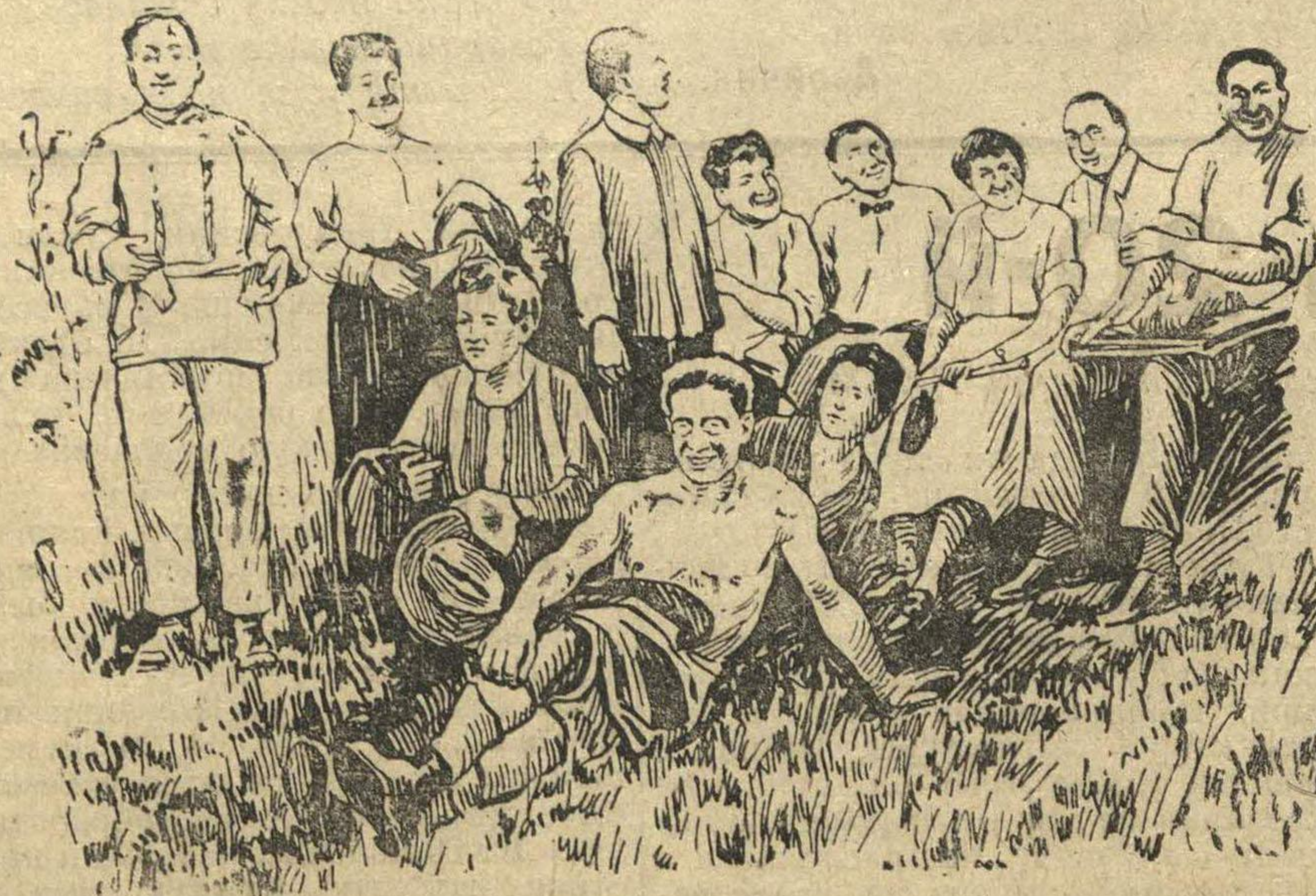
Члены 5-го Конгресса Коминтерна на Международном Красном стадионе на Ленинских горах (Воробьевы горы) в Москве. Представители Итальянской Коммунистической партии чувствуют себя не как дома, а гораздо лучше. Они с радостью подставляют голые плечи под лучи советского солнца.