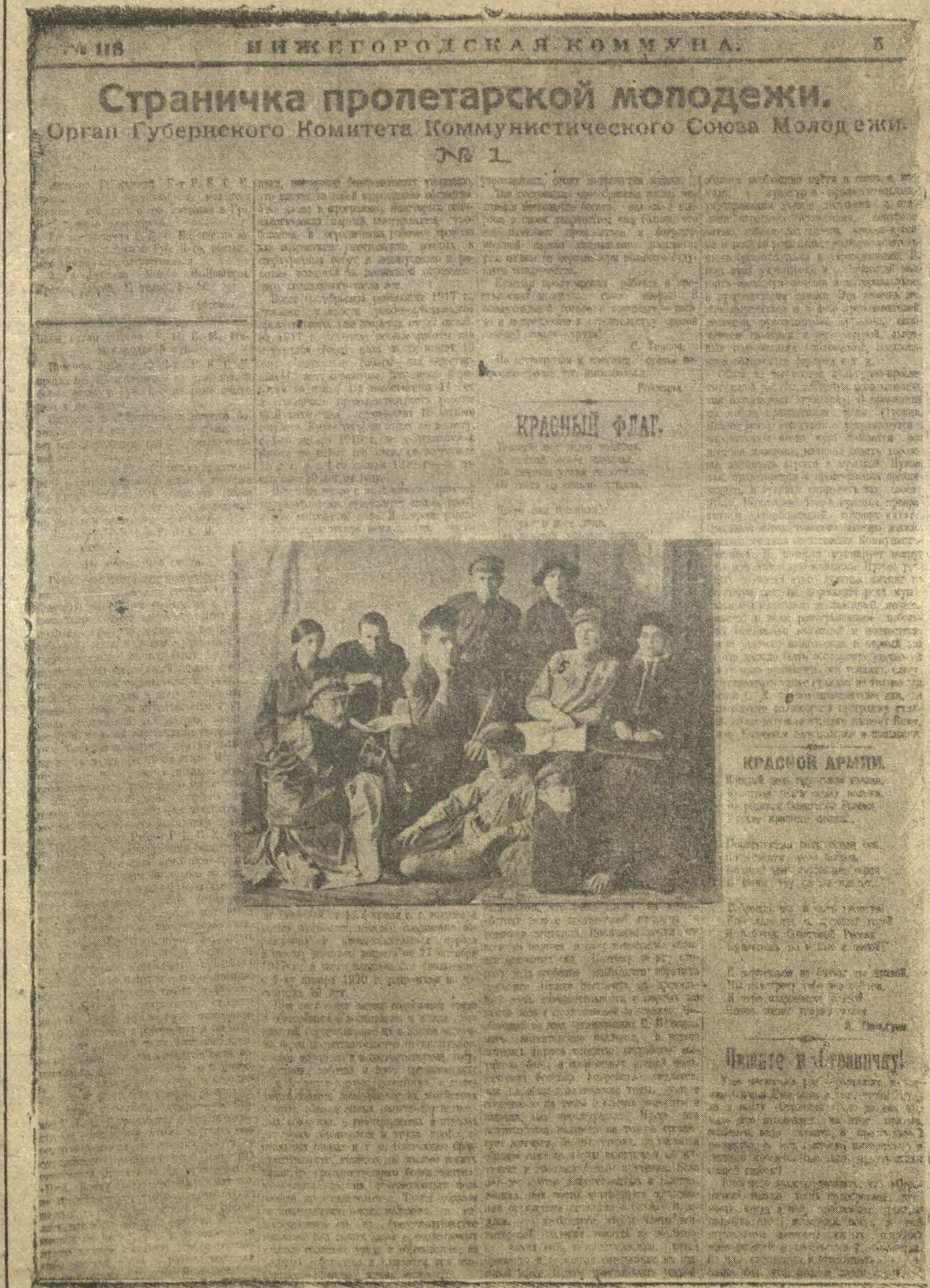
Страничка пролетарской молодежи. Орган Губернского Комитета Коммунистического Союза Молодежи.