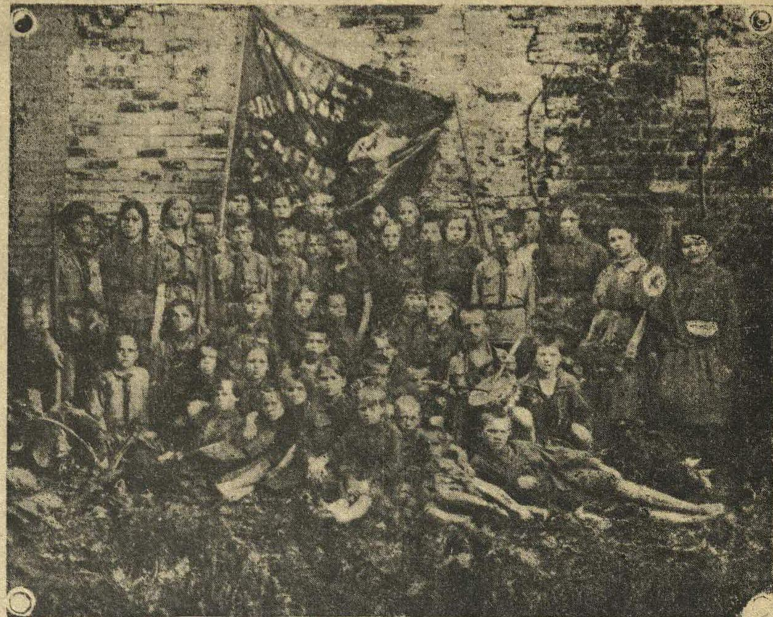
Отряд пионеров им. С. Перовской при союзе Нарвезия.