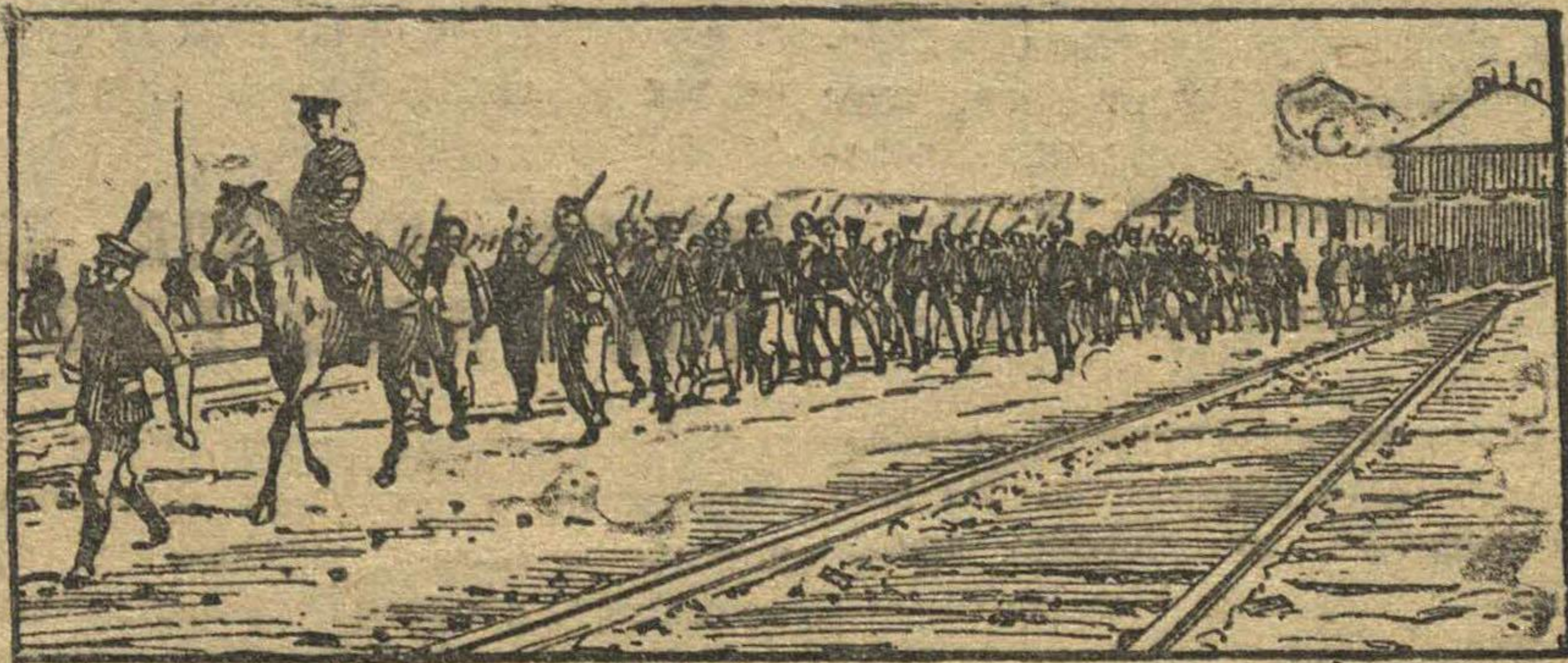
Продвижение китайской пехоты Сун-Ят-Сена.

Борьба между Чжан-Цзо-Лин и Сун-Ят-Сеном с одной стороны, и У-Пей-фу и пекинским правительством—с другой, в самом разгаре. Борьба может длиться еще долго, но за это