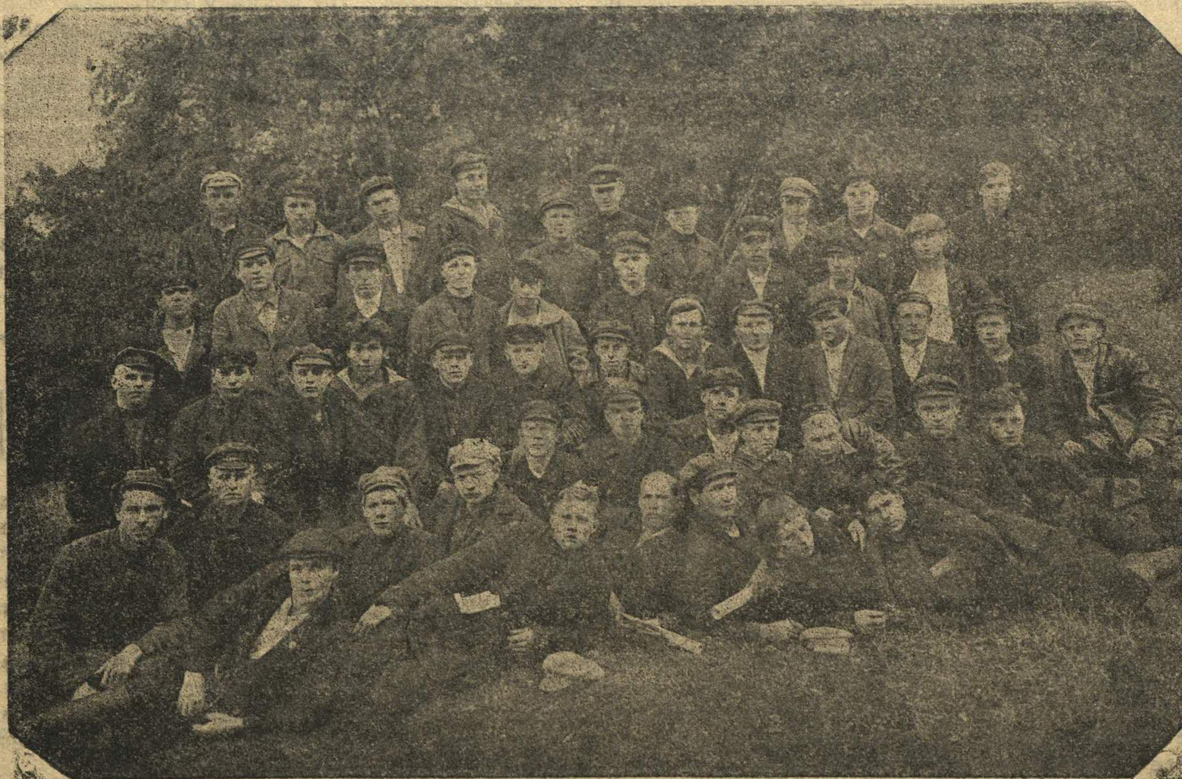
Комсомольцы посланные Нижегородской организацией во флот в сентябре 1924 г.

Решающее значение в жизни Красного Флота имело принятие шествия Комсомолом, благодаря чему на деле флот связался с миллионными массами трудящихся Советского Союза. Во время «Недели Красного Флота» — агитационной кампании, которая была проведена в начале 1923 г.—Комсомол привлек внимание к Красному Флоту со стороны широких трудящихся масс. К данному времени Красный Флот—обновлен и пополнен отборной пролетарской молодежью, успешно прошедшей военно-морские школы и получившей надлежащую морскую практику. Материальная часть флота приведена в удовлетворительное состояние. Идет работа по улучшению и совершенствованию военно-морской техники. За время летних месяцев текущего года военные корабли Красного Флота находились непрерывно в учебном и практическом плавании, при чем часть судов выполнила дальнее заграничное плавание. Вполне успешно также проведены маневры Красного Флота на Балтийском, Черном и др. морях. В общем мы можем заявить, что тот маленький флот, который имеет Советский Союз—приведен в порядок и имеет известную боеспособност. В отмеченных достижениях