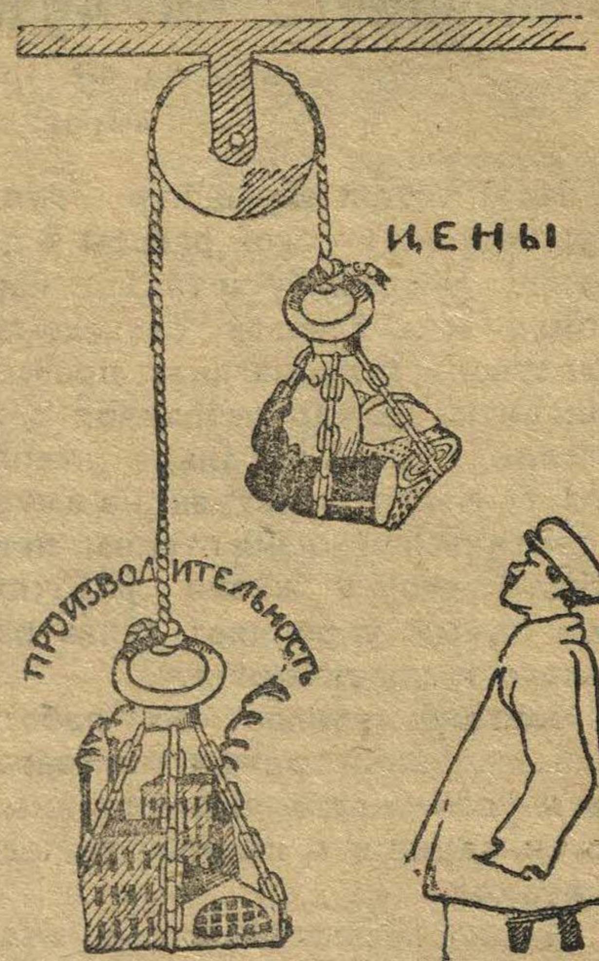
Чтоб снизить цены—нужно поднять производительность труда.

териальной помощи нет—нет и их. Имеющиеся учебники почти все—преподавателей, которые приобретают их на свой счет. Но еще хуже обстоит дело с посещаемостью. Много у учени- ков пропусков в виду отъезда Райкомом по комсомольским де- лам. Юнкор Оно