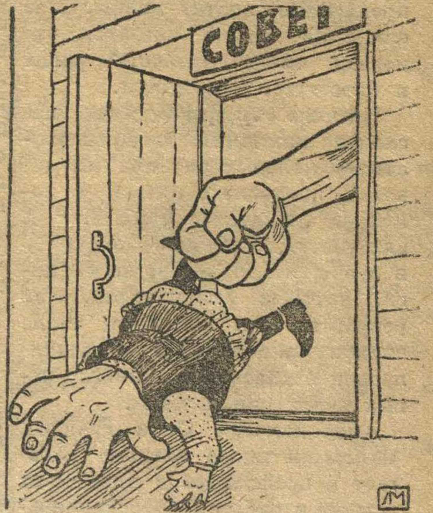
А их НАДО не выбирать, а ВЫПИРАТЬ.