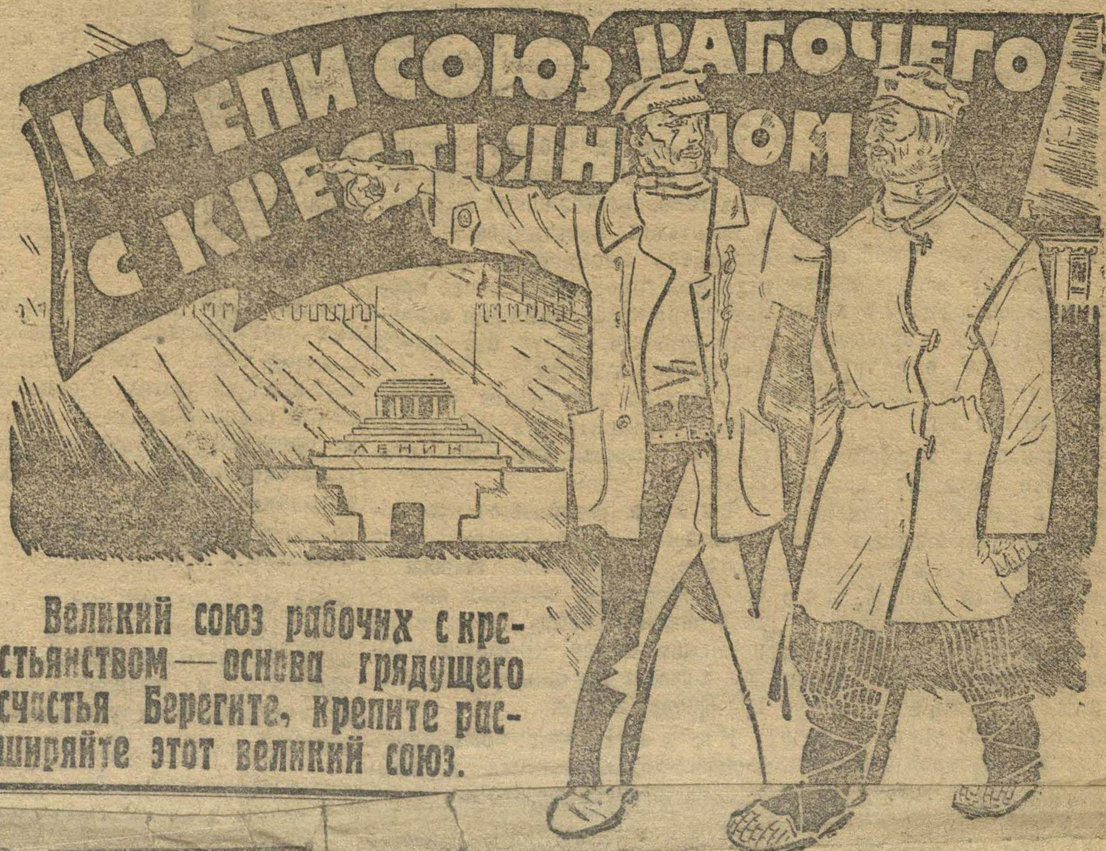
Великий союз рабочих с крестьянством — основа грядущего счастья. Берегите, крепите, расширяйте этот великий союз.