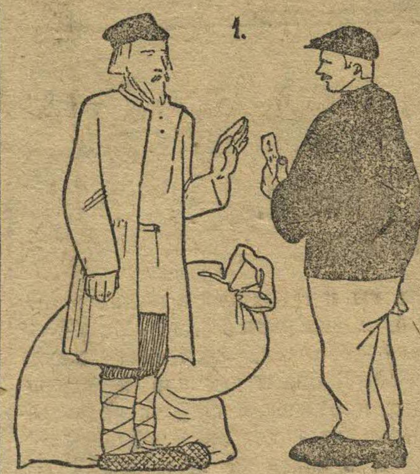
1. Просил рабочий у мужика хлеба. «Дешево даешь» — сказал мужик. «Но государство не может платить больше. Как хочешь. Тогда я отдам хлеб частному скупщику он даст дороже».

Советское государство устанавливает твердую заготовительную цену на хлеб так, чтобы не затормозить ход строительства Советского хозяйства. Если будут расти цены на хлеб, то рабочим придется увеличить заработную плату, чтобы они могли