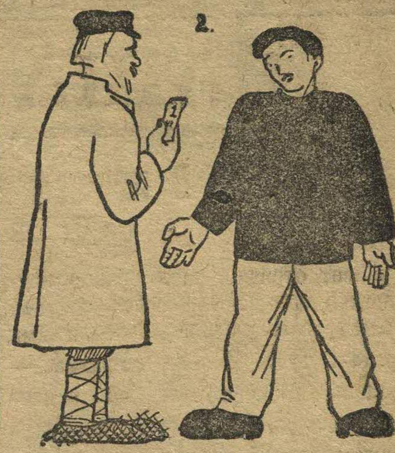
2. Когда крестьянин пришел на вырученные деньги купить товаров — оказалось, что они вздорожали. Вот видишь, — сказал рабочий, — скупщик, продал мне твой хлеб, вдвое по дорожали Товары. Ты, гонясь за прибылью, — получил убыток.

покупать то же нужное им для существования количество хлеба. Это будет накладным расходом и от этого вздорожают фабрично-заводские товары.