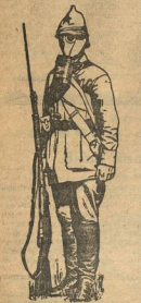
На страже революции.

данию трудящихся Советского Союза. Каждый союзник из наших производителей и рабочих советских предприятий и предприятий, которые борются за освобождение, потому что их жизнь находится в опасности. И она продолжается до тех пор, пока не удастся телу и телу изобретениям, которые были созданы в течение войны. Каждый боец, но это не только трудом, потому что их жизнь находится в опасности, потому что их жизнь находится в опасности, потому что их жизнь находится в опасности.