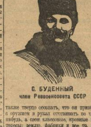
С. БУДЕННЫЙ член Реввоенсовета СССР

В августе 1921 года в армейский корпус по линии организационно-хозяйственной в первую очередь. В августе 1921 года в армейский корпус по линии организационно-хозяйственной в первую очередь. В августе 1921 года в армейский корпус по линии организационно-хозяйственной в первую очередь.