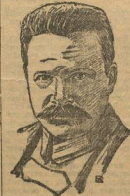
М. Фрунзе предприниматель и революционер.

В отношении Красной армии и, конечно, самым горячим предметом является революционная Россия — Москва — Фрунзе.