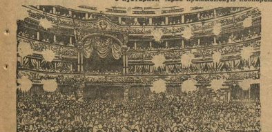
Плюм съезда в Большом театре

Промышленность растет, догоняет довоенную.—Крупная промышленность должна вступить в союз с кустарной через промышленную кооперацию