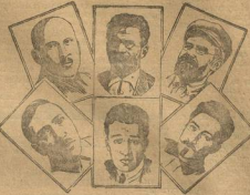
Вверху (слева направо): т. Чесноков А. Г. — председатель ЦИК Белорусии, тов. Калинин И. И. — председатель ЦИК УССР, тов. Петровский Г. И. — председатель ЦИК Украинской ССР, тов. Уховский — председатель ЦИК Казахской ССР, тов. Уханов — председатель ЦИК Узбекской ССР, тов. Антонов — председатель ЦИК Туркменской ССР.