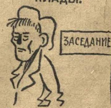
2. ПОСЛЕ ДВУХ ДОКЛАДОВ.

В декабре стоял вопрос о самообразовании — поговорили и успокоились, в январе заслушали отчет вожатого юл, — и без обсуждения разошлись. Разве нет волнующих вопросов? О колдоговоре, расценках, поднятии квалификации. Не ставили вопроса о Ленине (в траурные дни), о К. Либкнехте, о переходе «Молодой Рати» на еженедельно.