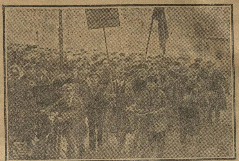
Рабочие крупного завода Вегелин и Гюбенер в Галле, оставив работу, общей колонной, под красными знаменами, направляются в Народный Парк на стачечный митинг.