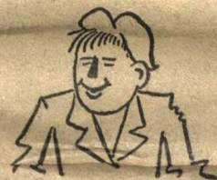
1. ДО ДОКЛАДА.

На последнем собрании бюро решили провести беседу «о комсомольской этике». Предварительно известили ребят, пришел руководитель и вместо доклада просто спросил: