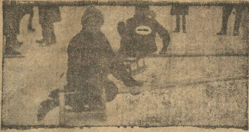
ВОТ ГРАМДИОЗНАЯ КАРУСЕЛЬ!