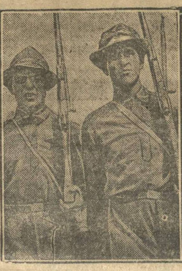
Члены правления завода «Ворошиловцы» на заводе им. Дзержинского (Донбасс).