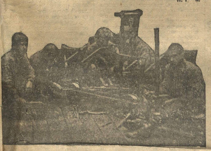
Вместе с рабочими перестраиваем свое производство.

Восемнадцать тысяч рублей для большого заводского гиганта — ничто, или почти ничто, а для Богородского завода — ШКОЛЫ ФЗУ, где работает всего 140 рабочих, учеников и служащих, эта сумма громадна. Сэкономлено эти 18 тысяч не вдруг, не сразу, а за год и 3 месяца. Экономия произошла за счет рационализации производства, в которой главным застрельщиком была молодежь.