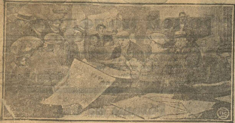
В ЧИТАЛЬНЕ КЛУБА.

(Новороссийск). Во всех портах «интернациональной» Европы моряка, прежде всего тянет в публичный дом и кабак.