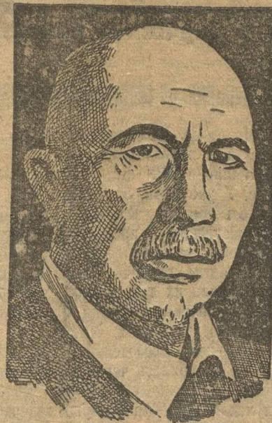
А. С. СЕРАФИМОВИЧ.

Сегодня днем приехал в Н.-Новгород, по приглашению НАПП, пролетписатель А. С. Серафимович.