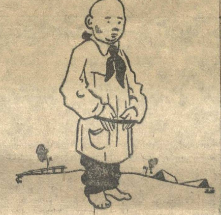
...«ОН ЛЮБИТ ПО ТОЛСТОВСКИ ЗАСО- ВЫВАТЬ РУКИ»...

Прозвиге ему было давно потому, что он был Лев. Но прочно престо- ло к нему, конечно, потому, что босой, в черных штанах и парусиновой длин- ной рубашке с ремешком, за который он любил по-толстовски засовывать ру-