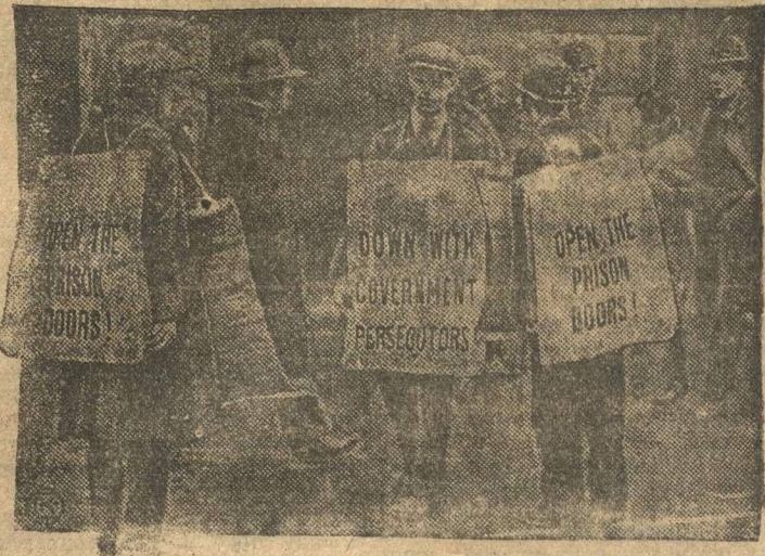
Мопром организована в Мендон (Англия) демонстрация протеста против створа профсоюзов с промышленниками о наступлении на рабочих (смотри «М. Р.» № 2). На снимке агитаторы с планетами. «Долой правительство угнетателей» и т. п.

ЛОНДОН, 3. Помимо демонстраций в Бомбее, организованных частью населения, состоялась демонстрация протеста в Мадрасе. Между сторонниками различных направлений из демонстрантов в Мадрасе произошло столкновение. Полиция открыла огонь. 2 участника демонстрации убиты, 17 ранены. Ранены также 3 полицейских. В Мадрасе закрыты все торговые заведения и промышленные предприятия, принадлежащие индусам. Порядок еще не восстановлен. Службы войска. Толпа, собравшаяся перед Верховным судом, бросала камни в полицейских и начала на европейских, возвращавшихся домой на автомобилях. Два автомобиля были толпой уничтожены. В Калькуте также объявлена забастовка протеста. На окраинах города автобусы и трамвайные вагоны забрасывались камнями. Патрульную службу в этих районах несут теперь броневики. Трамвайное и автобусное движение происходит под охраной полиции.