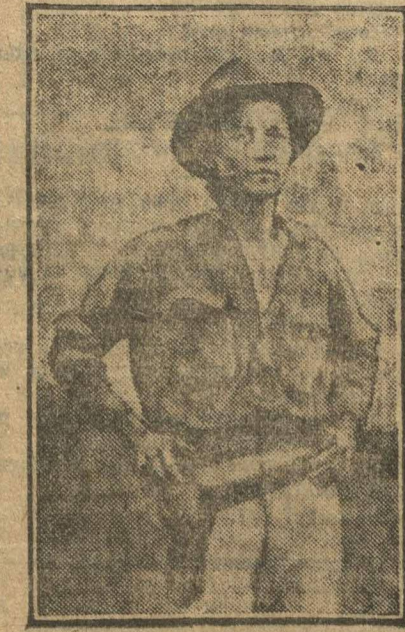
Вождь либералов Монкада «нарек» свою тринадцатилетнюю дочь невестой Сандино и помог своему будущему зятю пройти в парламент в качестве депутата.

Сандино доверил этим обещаниям и прекратил борьбу. Обещания выполнены, конечно, не были, но самого Сандино не трогали, так как консервативное правительство его боялось. Либералы же уважившись за него, думая с помощью его популярности поднять свой собственный политический кредит в стране,