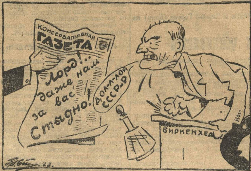
И САМИМ УЖЕ СТЫДНО.

Один из самых твердолобых консерваторов Биркенхед сделал новые выпады против СССР. Консервативные газеты считают это выступление слишком резким.