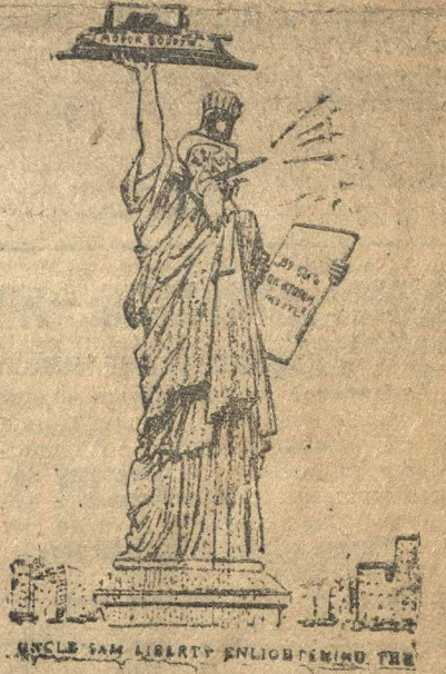
LET US BE FREE

«Американская Свобода» обещает мир, прочитав подписанную эту карикатуру из английской газеты. Англичане изображали известную «Статую Свободы» в Нью-Йорке, дав ей длинный шар, в руку—дредноут, под мышку—скрижалу с надписью: «не быть на втором месте»—намек на американскую программу морских вооружения.