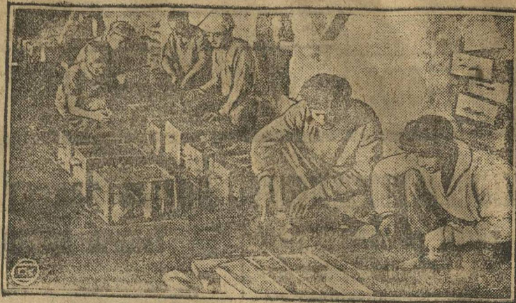
Школа фабрично-заводского ученичества имени Камо в г. Тифлисе. На снимке — фабзайчата в литейной мастерской.

Готовятся квалифицированные кадры для промышленности нацреспублик.