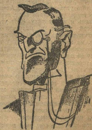
СЭР ОСТИН ЧЕМБЕРЛЕН.

ЛОНДОН, 9. Чемберлен заявил в палате общин, что число сухопутных войск в Китае уменьшилось с 12.500 чел. до 4.500. Кроме того, отдав приказ об отводе еще одного батальона.