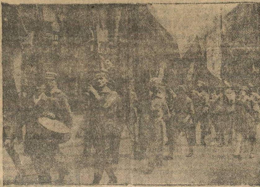
Революционные германские рабочие имеют боевую организацию — Союз красных фронтовиков. На нашем снимке — красные фронтовики на демонстрации.