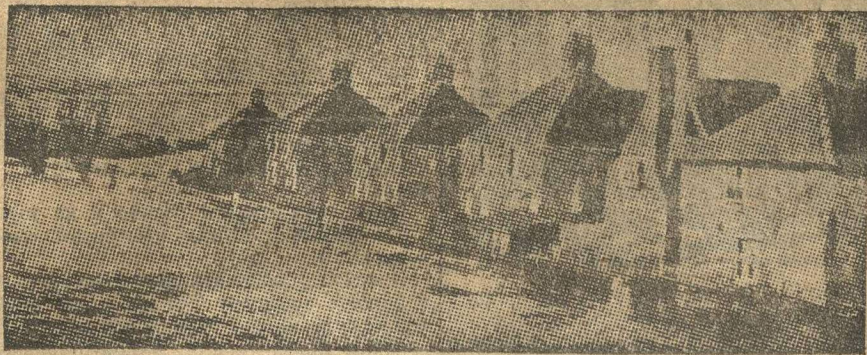
На снимке разлив реки Темзы в низменной части приречного Лондона.

Лондонское наводнение, недавно прокатившееся стовишь многих человеческих жизней и неисчислимых материальных убытков, продолжает волновать английское общественное мнение. Наводнение захватило врасплох и население и власти, после того, как катастрофа разразилась, паника и сумятица продолжалась в течение нескольких дней. Кто виноват в этом? Вот вопрос, который раздается со всех сторон.