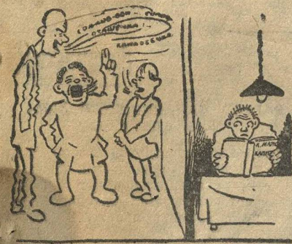
— Соловей, соловей—пташечка Кенареечка жалобно поет...