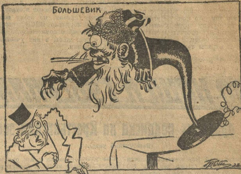
Большевистский громко-пропагандист в представлении венгерских буржуа.