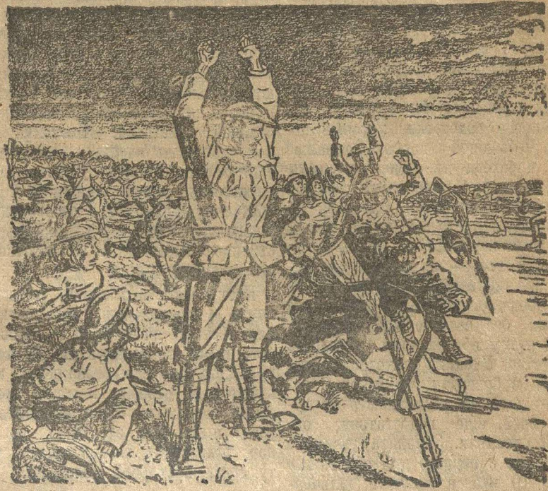
Рис. худ. Гриффель.

Германские рабочие приветствуют Красную армию. Грандиозный митинг в Берлине.