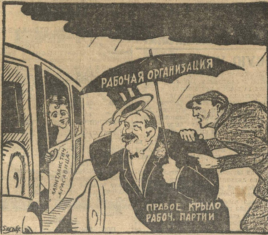
РАБОЧИЙ (соглашатель): — Эй, садись на лучше в карету с красавицей, которую ты обожаешь. А зонтик твой оставь мне. (Рисунок из английской коммунистической газеты «Уорнерс Лайф».)

Ряд английских рабочих организаций высказался против политики сближения с предпринимателями, ведущейся генсевами.