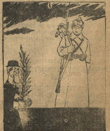
— У этого штыка — миру спокойнее.