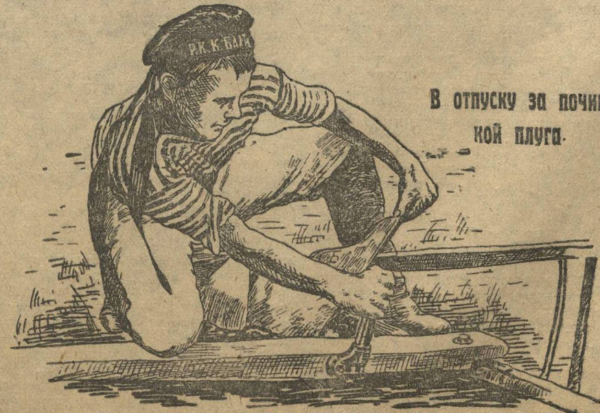
В отпуску за починкой плуга.

«По морям, морям, морям, Ныче здесь, а завтра там...»