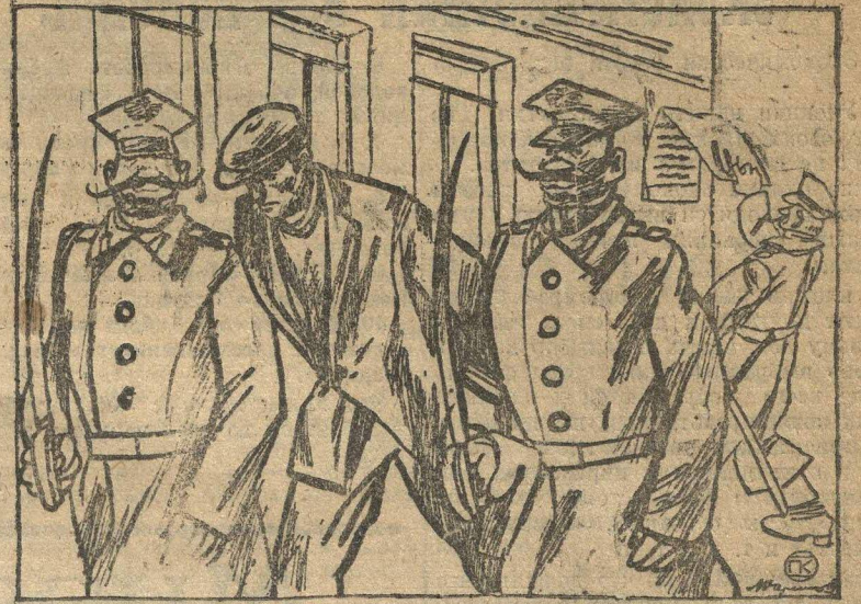
Польское правительство не подозревает, что именно оно лучше всех агитирует за успех рабоче-крестьянских депутатов.

В ряде городов Польши продолжаются аресты деятелей блока «Рабоче-Крестьянское Единство».