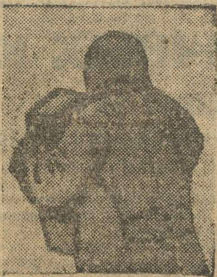
У ней приятная дочь и она не захотела сниматься крупным планом.

«Одна прелестнейшая особа составит ваше счастье. Не будьте за-