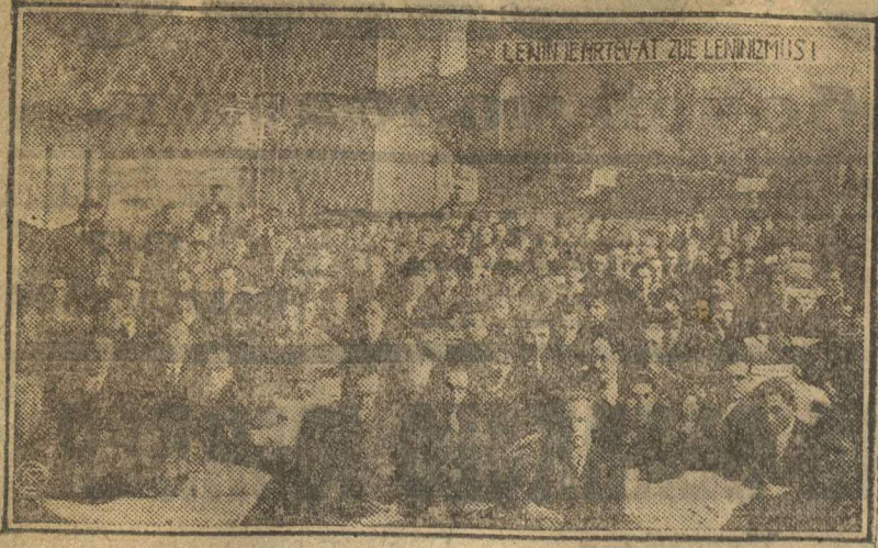
В конце января в Праге происходил с'езд комсомола Чехо-Словакии. На снимке—заседание с'езда. Трибуна президиума осеена лозунгом: «Ленин умер—жив ленинизм».