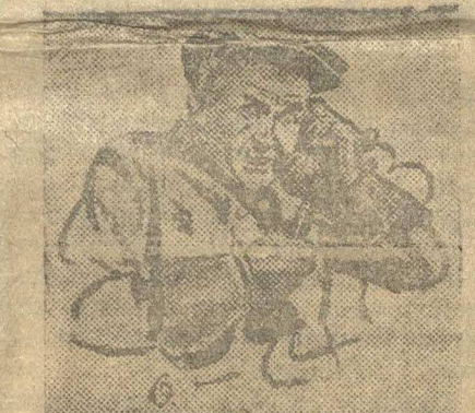
приключенческая повесть — «Бунт атомов»?

Алло, Алло! Знаете ли вы, что завтра в «Молодой Рати» начнет печататься