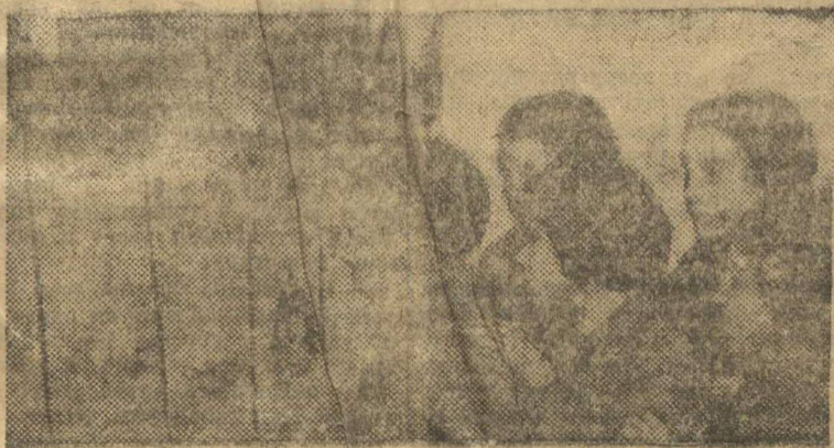
Пионеры читают заметки о трудовых и технических навыках, помещенные в стенгазету.