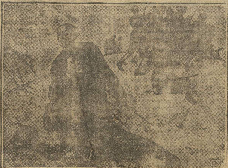
«Смерть комиссара» — картина Петрова-Водкина (масло).