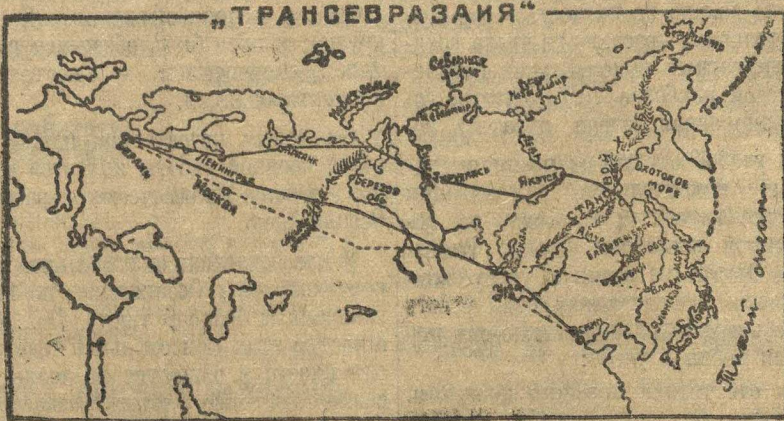
ОБОЗНАЧЕНИЯ: — — — — — Главные варианты дирижабельной линии по проекту Бруна. — — — — — Проектируемая самолетная линия.

ПРИМЕЧАНИЕ. Пленум Губкома, на котором было зачитано приветствие молитовцев, поддержал их просьбу о присвоении фабричной школы рабочей молодежи звания школы «имени десятилетия комсомола».