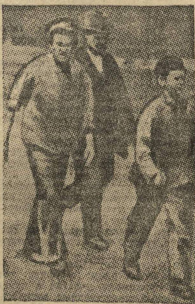
Типы германских металлистов.

Но в Египте неуклонно назревает сильное недовольство против англичан. Сейчас оно вылилось очень сильно.