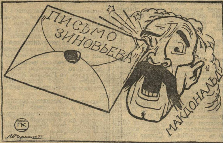
ДАЛЬНЕЙШИЙ ПУТЬ ЗНАМЕНИТОЙ ФАЛЬШИВКИ. (См. статью «Скандал мирового значения».)