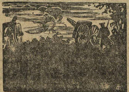
... К полудню цепь батарей готова была встретить неожиданного врага.

В костелах звонили колокола и служили торжественные молебствия об избавлении от стихийного бедствия, по улицам шли бесконечные крестные ходы.