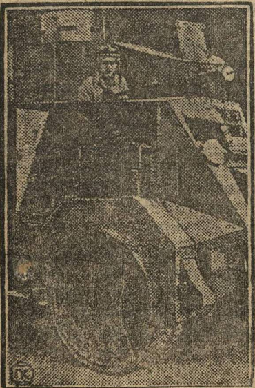
Берлинская полиция пользуется всеми средствами военной техники в борьбе с рабочими. Недавно введенные ею танки предназначены для уличных боев. На снимке—один из танков берлинской полиции.